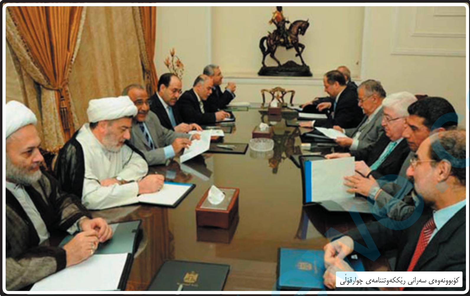
کۆبوونەوێ سەرانی رێککەوتنامەى چوارقۆلى

لە خویندەنەوێ ئەو چەند پیدراوه سیاسییە سەرەو، ئەو رۆندەبیتەو