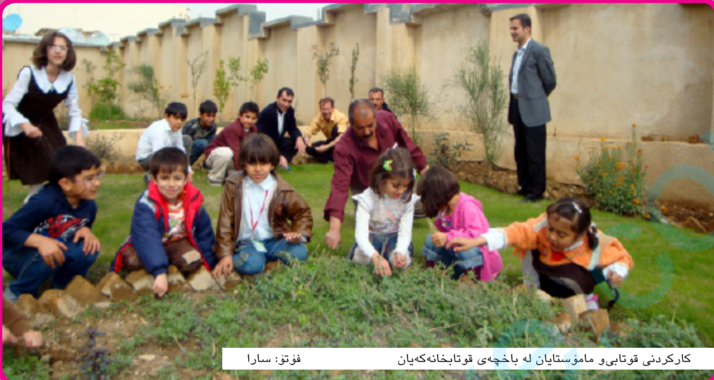
کارکردنی قوتابی و ماموستایان له باخچهی قوتابخانه کیان

باشتروایه له کاتی نۆزه نکرده وه و دروستکردنی قوتابخانه کاندایا گرنگی به باخچه کان بدی و به شیوه به کی پلان بۆ دارپژراو زهوی به کی خولی به سوودی تی بکری و سیاج و لیوار به ندی باشی بۆ بکری، چونکه کاتیک قوتابخانه له ورووه وه فه راموش بکری، دواتر قوتابخانه که ناتوانیت به و پاره که مهی هه یه تی باخچه که ریکبخته وه وه هروه ها وتی: «داواکارین له به ریوه به ری تی په روه رده باخه وانی زیاتر بۆ باخچهی قوتابخانه کان دابمه زینیت، یان له ریگه کی کومپانیای تابیبه ته وه نه وکاره نه نجام بدات».