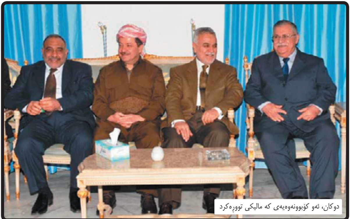
دوکان، ئەو کۆبوونەوێهەى کە مالیکى توورەکرد

سیاسییە براوہکانى هەلبژاردنیش بە رەفتارى مرقیکی تیرەو ریککەوتنە تەوافوقیەکانیان دەخەنە ژیر پرسیارو داواى پیناچوونەو دەکەن، وەک ئەوێ لەم رۆژانەدا کە مالیکى نایەوئیت جاریکى یەکە بچیتەو ئەو ئیقتیلافى براکانى لە ئەنجومەنى بالای ئیسلامى و هەستەکات ئیتر ئەو پویوستى بەو تەوافوقاتو ئیقتیلافى پشتر نەماوه. لێدوانەکانى سەرۆکى هەریمو مام جەلالیش لەکاتى کۆبوونەوێ دوايان لەسەر لیستەکان، هەر ئەوێ لێدەخوئیتەو کاتیک ئامازەیان بەویدا کە ئەوان دەیانەوئیت لە لیستەکاندا هەر خۆیان بنو خۆیان تاقیدەکەنەو، بەرامبەر لیستەکانى دیکە، دلتیاشبوون لەوێ «شیربیترن لای هاوالاتى زیاتر لەوێ حیزبەکان بە تالیان دەزانن»، کە زۆرینە دەبەنەو، بەلام واپیندەچیت دواى هەلبژاردنەکان و لە نزیکترین ئەگەردا، هەریک لە تەوافوقو هاو پیمانیتییەکى یەکیتى نیشتمانى و پارتى دیموکراتیش هەر هەمان ئاستى هەماهنگی ئەنجومەنى بالاو حیزبى دەعوێ هەبیت، دواتر رووداوو دەنگو پۇستەکان لایەکیان بیاک بکاتو تەوافوقەکە هەلوەشیتەو کیشە داپۆشراوەکانیش ئاشکرا بکەن. ئەمرو نەک تەنیا کوردستان، بەلکو کوى عێراق بەو دۇخدا تیندەپەرتیت کە سەرەمى ئاشکراوونى کیشە هەلواسراوہ داپۆشراوەکانە، کە سالانیکە تەوافوق داپۆشبوون، چونکە تەوافوق تا ئەوکاتە بەرگە دەگریت کە هەلبژاردنیکى نوئى ئەجامدەدریت، تواناکەشى هەر ئەوئەندەبە کە تەرازووی دەنگەکان دەبگورن.