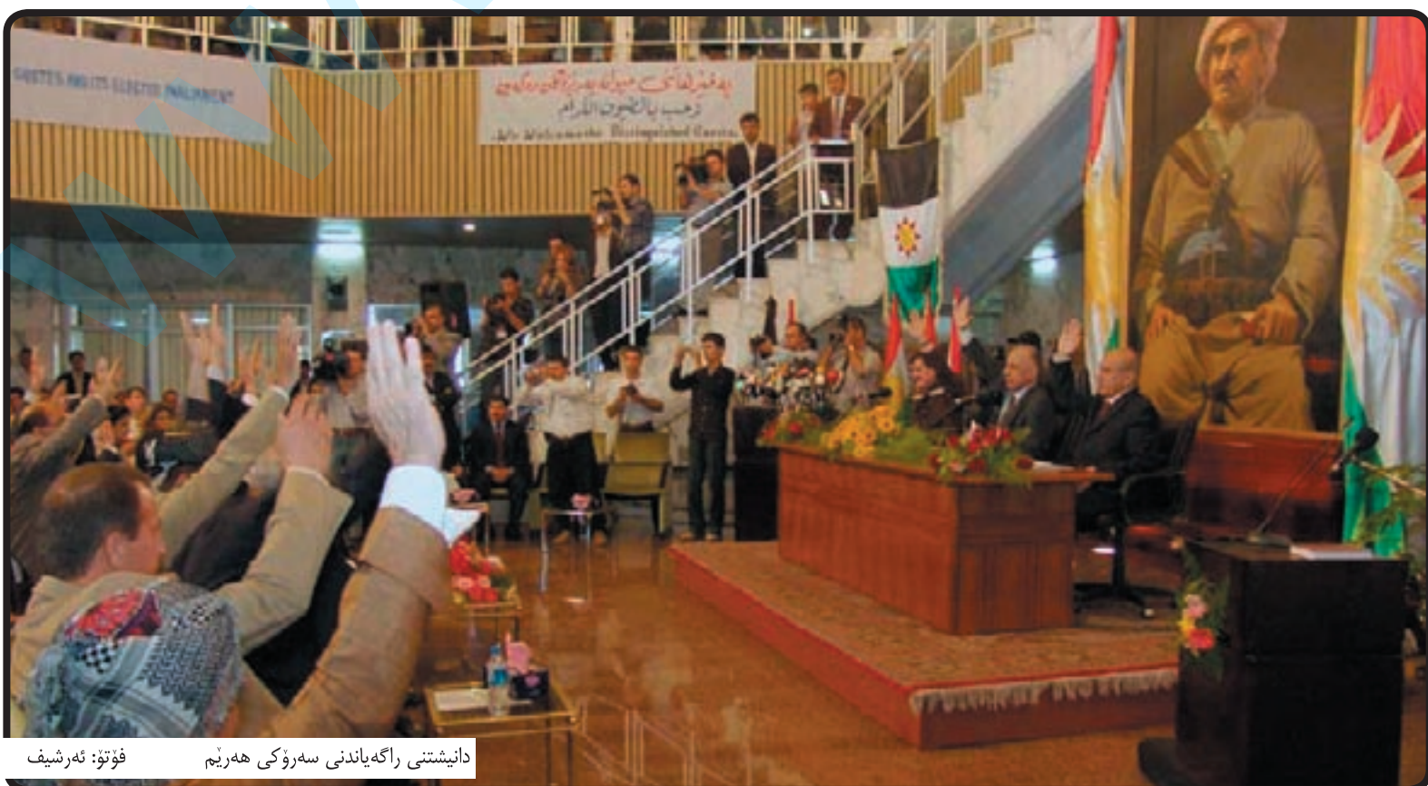
دانیشتنی راگە یان دین سەرۆکی هەریم

بە شیک لە ژنان ھۆکاری کەمیی ژن لە ناوہندەکانی بریارو پۆستە بالاکاندا بۆ