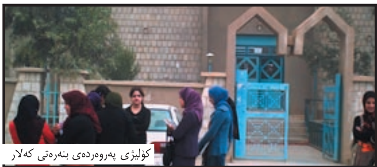
کۆلیژی پەرۆردە ی بنەرەتی کەلار

«لابردنی من کار ناکاتە سەر ئەوہی کە من بێ وەرەبم لەخزمەتکردن، ھەرچەندە تانیستا روون نییە کۆن لەبشت لابردنمەوہیە، تەنیا ئەوہ نەبیت بەو نووسراوہ ئاگادار کراومەتەوہ کە کەسیکی دیکە کراوہتە راگری کۆلیژە کە».