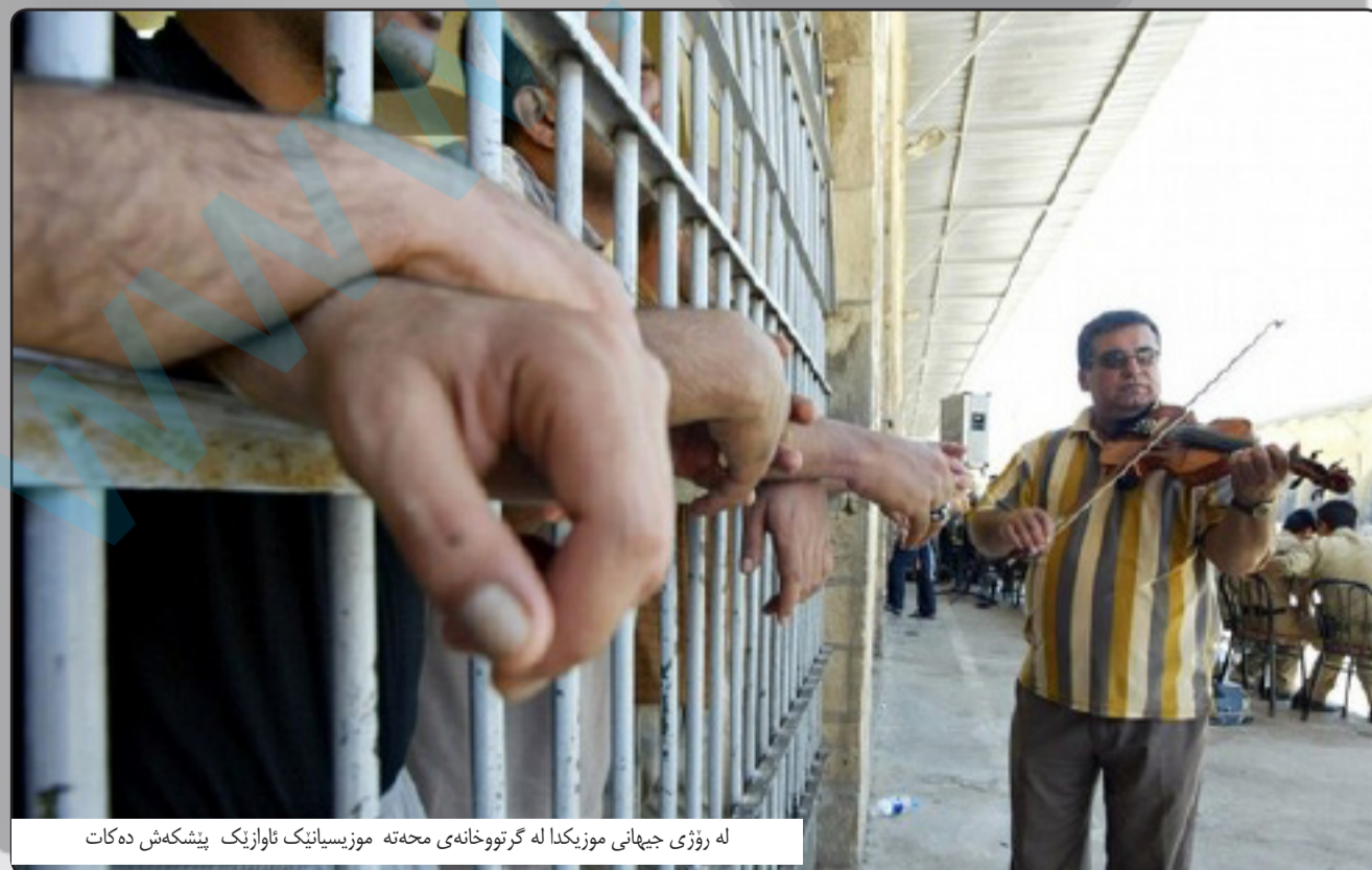
له روژی جیهانی موزیکدا له گرتووخانه ی محه ته موزیسایینیک ناوازیک پیشکش ده کات

* گوږگرتن له دهنگه سرو شتییه کان وهک دهنگی شه پوله کانی دهریا، یان بیده نگیی دارستانیکی کپ، (۱۵- ۲۰) خوله ک پیاسه کردن له مجوره شوینانه دا، هیلاکی و فشاره د پروونییه کان که مده کاته وه، دهشتوانریت به کاسیت گوئ له م دهنگانه بگریت نه گه ر دوو بوو له شوینی کارو حه وانه وه.