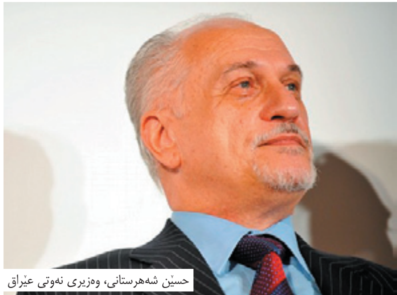
حسین شههرستانی، وهزیری نهوتی عیراق

ئیسنا (۱۴۰) ئیمزا له لایه ن په رله مانترانه وه کۆکروه ته وه بۆ ئه وه ی لیبیچینه وه له گه ل وهزیری نهوتدا بکریته. دهرباره ی هه لویستی لیستی هاوپه یمانی ئاماژه ی به وه کرد له کاتی بانگهیشتکرده کیدا بۆ پرله مان، لیستی هاوپه یمانیش هه لویستی له سهر لیبیچینه وه که ی حسین شههرستانی ده بیته.