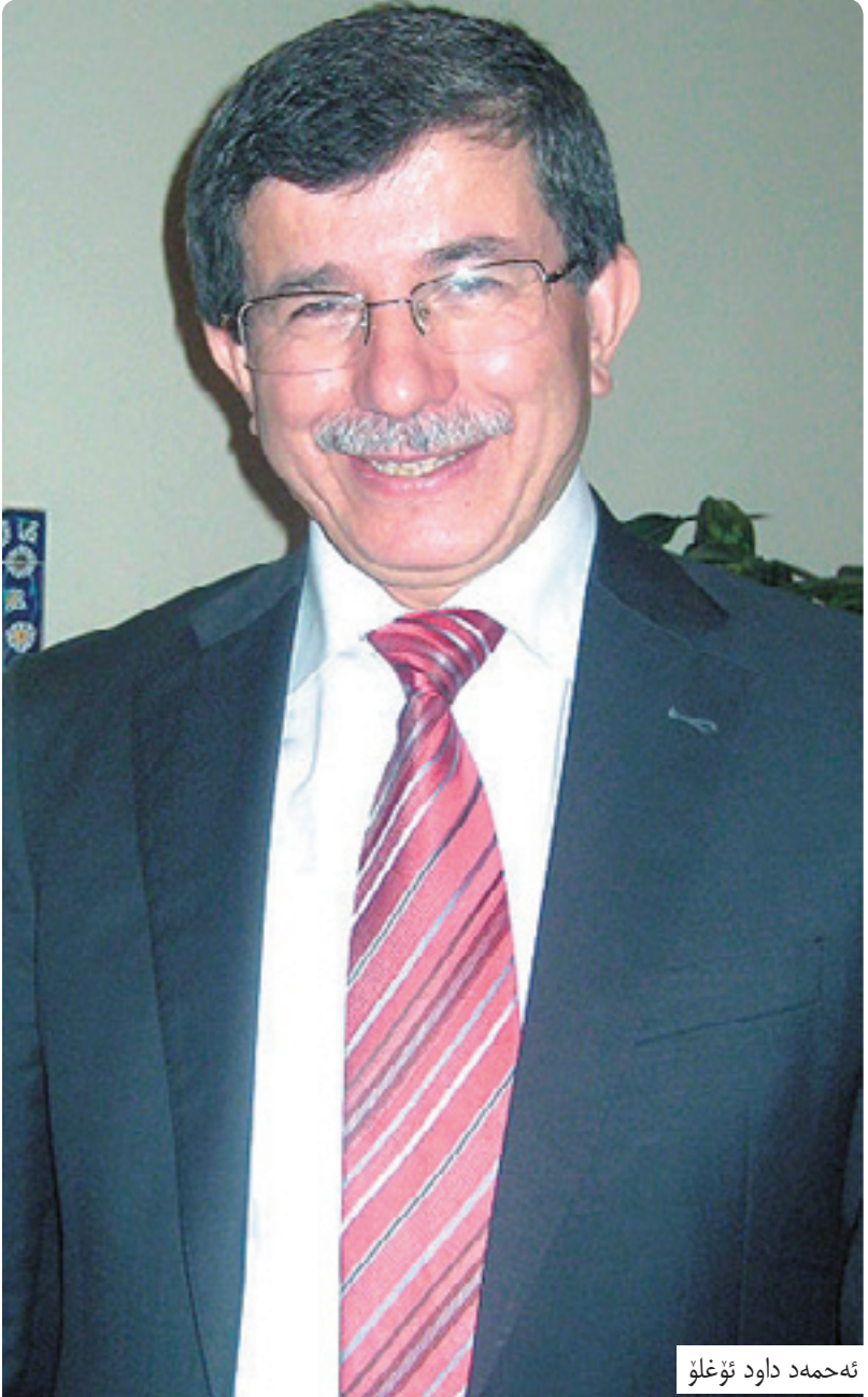
ئەحمەد داود ئۇغلۇ

ئارام شىخ وەسانى مامۇستاكەى ئەردۇغان، چ پلانئىكى نازەى هەيه؟ پروفىسۆر ئەحمەد داود ئۇغلۇ بە مامۇستاكەى ئەردۇغان ناسراوه، هەر لەسەداى سەرکەوتنى پارتى دادو گەشەپىدان وەك رايژكارىك لەپشتى ئەردۇغان بووه، ئۇغلۇ كە دارژەرى سياسەتەكانى ئەردۇغانە، سياسىيەتى نۆدەولەتى توركيانى بەپنى هەندىك سەرچاوه لەژىر سىبەرى رىنمايىيەكانى ئۇغلۇوه گوزەرى كردوو، ئەو لەسەرەتادا داواى ئەوهى كردوو كە تەنيا لە سىبەردا كاردەكات لەگەل ئەردۇغان، ئۇغلۇ ئەگەرچى ئەندامى پارتەكەى ئەردۇغان نىيە، بەلام دلسۆزىيەكى بىويەنى نواندوو بەرامبەر هەموو ئەو ئەگەر و پيشهاتانەى لەماوهى دەسلەلتى ئەردۇغاندا دروست بوون، هەر ئەو دلسۆزىيەش بووه واى لە ئەردۇغان كورد كە بىكات بە وەزىرى دەرەوهى توركيانى چىتر لەژىر سىبەرىدا كار نەكات. ئۇغلۇ لەگەل سەرکەوتنى ئەكەيه كئىنئىكى نووسى سەبارەت بە سياسەتى دەرەوهى توركيانى كە سەرنجى بەرپرسە سياسىيەكانى توركيانى راکيشا، ئەويش پەرتوكى (قولايى ستراتيژى) بوو، ئەگەرچى ئۇغلۇ پيشتر لە چەند دەولەتتیک بالويزى توركيانى بووه، بەلام بوونى ئۇغلۇ بە وەزىرى دەرەوه