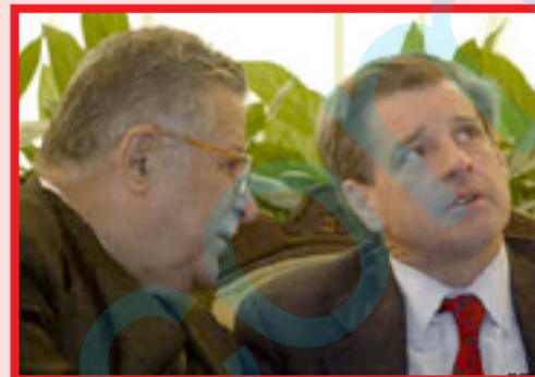
ئا: فلاح نهجم

دوای ئەو هی ئه وهی پۆل بریمەر حاکی مه دهنی عێراق، له لیدوانیکیدا راگه یاند، پاش نازادکردنی عێراق سالی 2003 کورده کان هه ره شهی ئە وه یانکردووه، ئە گه ر سوپای ئە و کاته ی عێراق هه لئه وه شهیته وه، ئە وا جیا بوونه وهی خۆمان له عێراق راده گه یه نین، سه رکرایه تی کوردیش ئە م لیدانه ی به ناراست له قه له مدا .