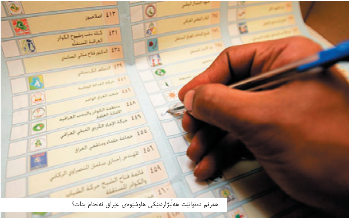
هه‌رێم ده‌توانیت هه‌لبژاردنێکی هاوشێوه‌ی عێراق ئه‌نجام ب‌دا؟

له‌گه‌ڵ ئه‌وه‌ی سه‌روکی ئوفیسی هه‌ول‌ب‌یری كۆمسیۆنی بالایی سه‌ر‌به‌خۆی هه‌لبژاردنه‌كان به‌ کاریکی ئاسایی دانا، كه‌ تۆماری پێکهاته‌كان به‌ر له‌ دیاریکردنی رۆژی هه‌لبژاردن ئه‌نجام‌داریت، ئاماژه‌ی به‌وه‌شدا كه‌ له‌ هه‌لبژاردنی ئه‌نجومه‌نی پارێزگا‌کانی عێراقدا به‌ر له‌سالیك تۆماری پێکهاته‌كان كراوه‌و ئاساییه‌، چونكه‌ ئه‌و پێکهاته‌ پ‌پ‌ی‌و‌اب‌و دیاری ب‌ک‌رین، بۆ ئه‌وه‌ی ده‌ست به‌ ئاماده‌ك‌ارییه‌كانی دیکه‌ بكریت. به‌لام، عه‌ونی به‌زان جیگری لیژنه‌ی