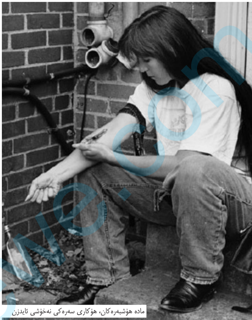
ماده هوشبهره کان، هۆکاری سهره کی نه خوشی ئایدزن

سهراوه یه که له به ریوه به ریتی ئاسایشی راپه رین (رانیه) بۇ روژنامه ی رونکردوه که سالانه به پیی