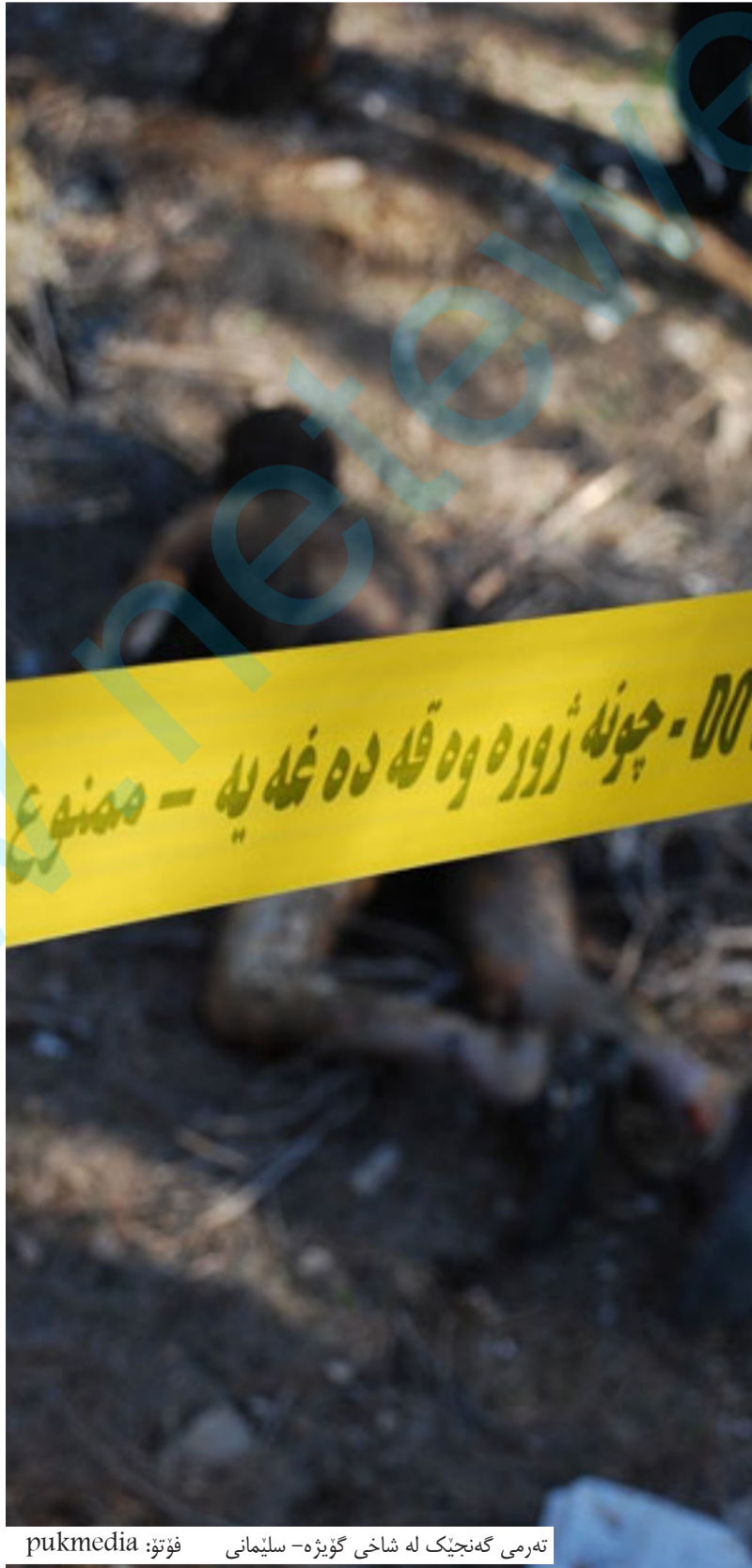
تەرمی گەنجیک لە شاخی گۆیژە - سلیمانی

خۆکوشتن: بریتیە لە کوتایهینانیکی دەستکردانەیی مروۆف بەژیانی خۆی ئەم کارەش لە ئەنجامی هەلبژاردنیکی نازادانەیی خۆیەتی دەرەق بەژیانی خۆی ئەنجامدەدریت، هەندیک جار کارەکە سەرکەوتو دەبیت و ژیانی کوتایی دیت و هەندیک جاریش کارەکە سەرکەوتو ناییت، بەپێی لیکۆلینەو زانستیەکان (۳۰-٪-۷۰٪) ی خۆکوشتنەکان پەپوهندییان بەخەمۆکییەو هەیی، چونکە لەکاتی خەمۆکیدا مروۆف بێرکردنەو ی دەشینیوت و ناتوانریت ژیرانەو دروست بیریگاتەو، ئەگەر ئەم حالەتە چارەسەر نەکرا ئەو هەستدەکات کە سیککی بیهیواو بیناخەو بێر لە کوتایهینان بەژیانی خۆی دەکاتەو.