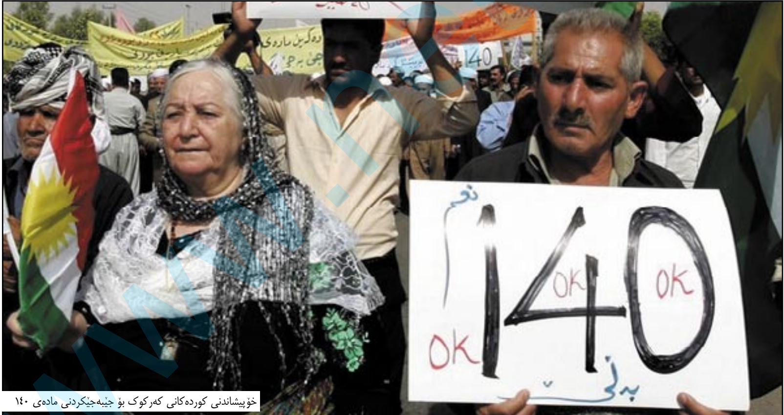
خویشاندنی کورده کانی که رکوک بۇ جیه جیکردنی ماده ی ۱۴۰