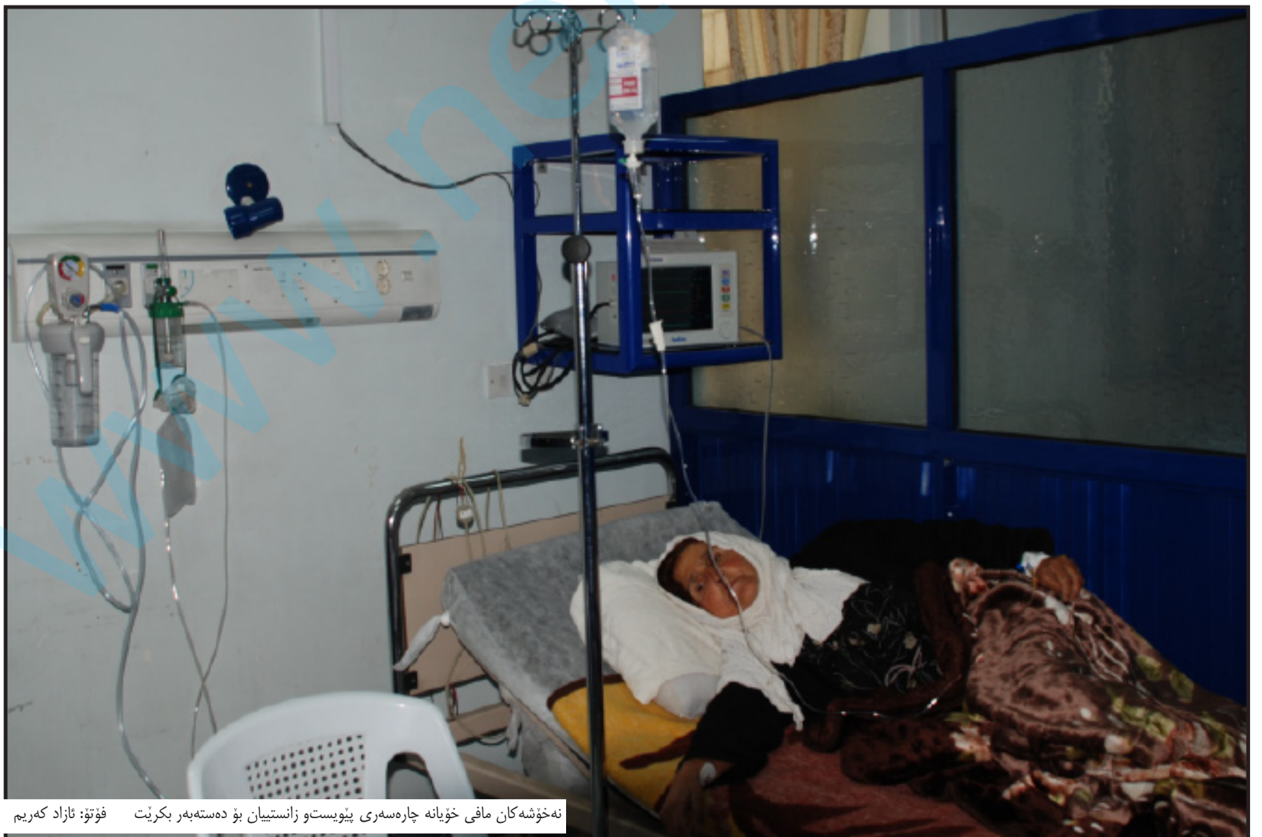
نەخۆشەكان مافى خۆیانە چارەسەرى پىوست و زانستیان بۆ دەستەبەر بکړیت