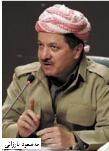
مه سعود بارزانی