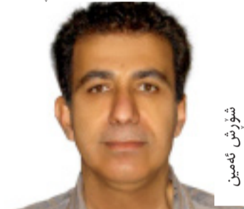
م. م. م.

هه روک وتیشی: «یهک لیستی له نیوان حیزبه ده سه لاتداره کاندیا شه ده گه یه نیت، که هچ لایه کیان ناماده نییه ملبدات بۇ دژاردن»، به لام شورش جهختی له وه کرده وه، که له هه لېږاردندا ده بیت یه کیکی بیدورینیت و