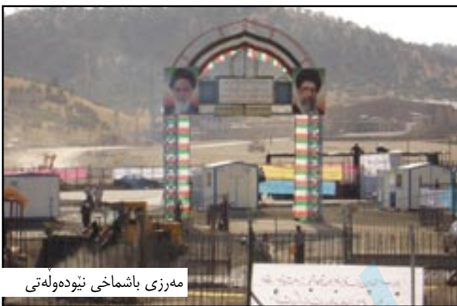
مهززی باشماخی نیوده وه لتی