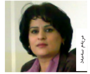
م. م. م.

مریه م سه مه د، چالاک له بوری کاری ریڅراوه بییدا، هاوپه یمانی نیوان حیزبه کانی پی باشته وهک له دابه زینان به لیستی سهره بخو، چونکه به رای شه له قوناغی نیستادا کورد پنیوستی به یه کده نگی و یه کرزییه، «له نیستادا، که مه سه له نیشتمانی و نه ته وه ییه کان چاره سر نه کراون و هه ره شه ی جیدان له سره، بیگومان یه کرزیی مالی کورد و