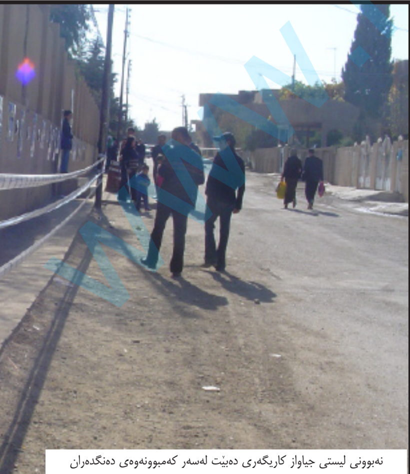
نه بوونی لیستی جياواز کاریگه ری ده بیت له سره که مبوننه وهی دهنگده ران

برده وهی خزی مسؤگر بکات و ریگا نه دات به بوونی هچ لیستیک جياواز له دهره وهی خوی»، به ریوه به ری په یمانگای کوردی بۇ هه لېږاردن