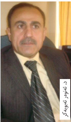
د. نه نومر نه بویه کمر

د. نه نومر به پیویستی زانی لیسته جیاکانی دهره وه ی دوو حیزبه که پیش هه ر شتیک نه و کاره نار ه وایانه راست بکه نه وه که نه و حیزبانه کردویانه، خه لکی پسپور بؤ پوست و بواره گرنگه کان