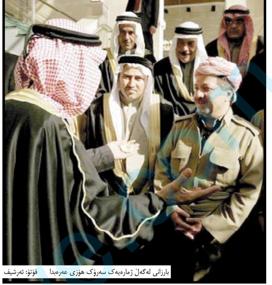
بارزانی له گه ل ژماره یه ک سهروک هۆزی عهره یانه

سهروکی ههریمی کوردستان فه رمانی نازادکردنی سهرحهم بهندکراوه عهره بهکان دهوات، که له گرتوخانهکانی ههریمی کوردستانان. جینگری پاریزگای موسلیش ئاماژه به وه دهکات، که نازادکردنی بهندکراوهکان له سهرو داوای هۆزه عهره ییهکان بووه. کۆتایی ههفته ی رابردو و مسعود بارزانی، سهروکی ههریمی کوردستان، فه رمانیدا به نازادکردنی سهرحهم ئه و زیندانییه عهره یانه ی دهره وه ی کوردستان، که له گرتوخانهکاندان و هیچ تومه تیکیان به سهردا ساغ نهبووتهوه و له و چوارچیوه یه دا تا ئیستا نزیکه ی (۳۰) بهندکراو نازادکراون. د. فوئاد حسین، سهروکی دیوانی سهروکایه تی ههریمی کوردستان، به روژنامه ی راگه یاند: ئه و بهندکراوه تی نازادکراون، پیشتر له لایه ن هیزهکانی ئه مریکا و عیراقه وه دهستگیر کرابوون، به لام به هوی بارودۆخی ئه منییه وه هینرابوونه ههریم و داوی لیکۆلینه وه له دۆسیهکانیان، ئهوانه ی به شدار نه بوون له کاری توندپه وی و تیرۆرستی،