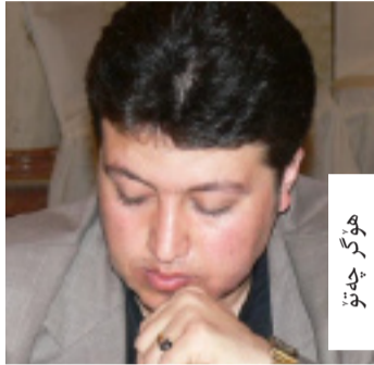
م. م. م.