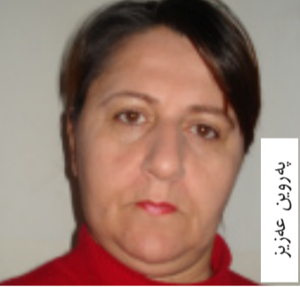
م. م. م.

پنیوایو بارودخی نیستای کوردستان به شیوه یه کی گژاوه که لیستی جياواز بوته واقعیکی و ده بیت شه هیزانه شه که له دژین، قبولی بکن. په روین عه زیز، به ریوه به ری ریڅراوی دهنگی پیران، پنیوایه دیموکراسی بریتییه، له حکومکردن له لایه نه خه لکه وه و هه لېږاردن یه کیکه