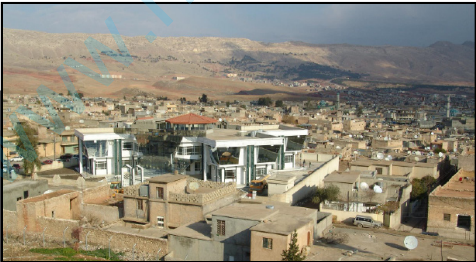
دیمه نیک له کویه

دانیش توانی سنوری قه زای رانیه زیاتر له (200) هه زار هاوالاتی ده بیون ریژه ی دانیش توانی قه زای کویه و ناحیه ی ئاشتی نزیکه ی (60) هه زار که سه، به و پییه ش کومپانیا تورکیه کان تا ئیستا نزیکه ی (300) هه زار هاوالاتیان له سنوری قه زای رانیه و کویه بی ئا و کردوه.