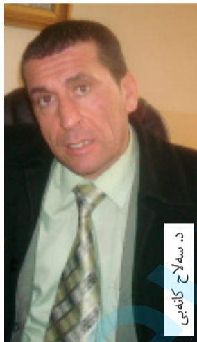
د. سه لاج کانه بی

د. دلیر نه محمد، راگری کولیژی زانسته مروقاتیه کان، به پیچه وانه وه ده دویست و ده لیت: «پیوانییه لیسته جیاواز هکان گوران بکن»، نامازه به وه شده کات له ولاتیکی دیموکراسیدا که هه مه رنکی پیوه دیاره، ناسایه لیستی جیاواز بؤ کاتی هلبژاردنه کان په یدان و به شداریه بکن بؤ به ده سته پنیانی کورسیه کانی ده سلات، لیره ش، که چهن دین حیزبی جیاجیا هیه و میدیای نازاد هیه، که واته پیویسته لیستی جیا ه بیته بؤ هلبژاردنه کان.