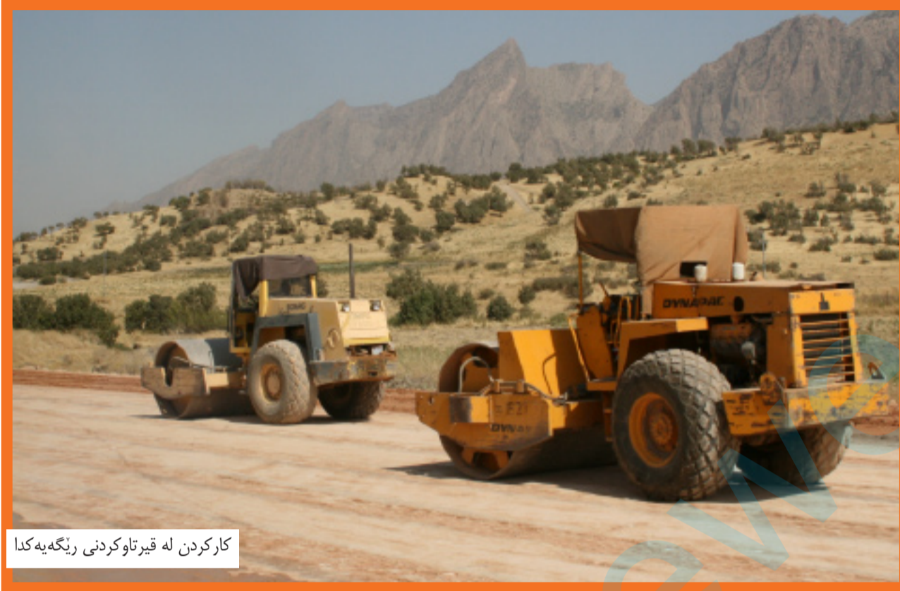
کارکردن له قیرتاوکردنی ريگه یه کدا

تهنها له سنوري پاريزگاي سلیمانیدا (۱۷۰) پروژهي ريگاوبانو ئاوه دانکردنه وه ههيه که له دوو سالی رابردودا دهست به کارکردن کراوه تيايداو تا ئیستا تهواو نه کراون، بهرپوهبهري گشتی ئاوه دانکردنه وه سلیمانیش نکولی له وه ناکاتو هوکاره که ی بۆ که می کارمهندو ناميرو گهوره یی پروژهکان دهگهړینتیه وه، دلپیت: «پروژهي ريگاوبان کاتی زوری دهویت».