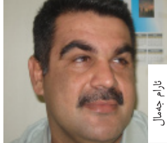
م. م. م.

نارام جه مال شه وهدا شه خسته پرو که نه بوونی لیستی جياواز مانای نه بوونی دیموکراسییه وتی: «شه و باوره ی دژی فره لیستییه و ریگری له بوونی دهنگی جياواز ده کات، جوریکه له عه قلیته ی ده یه ویت هه لېږاردن نه کات، به لام کاتیک ناچار ده بیت هه لېږاردن بکات، دیت ته کنیککی تر به کارده یینیت، که هه لېږاردنه ک وایینت