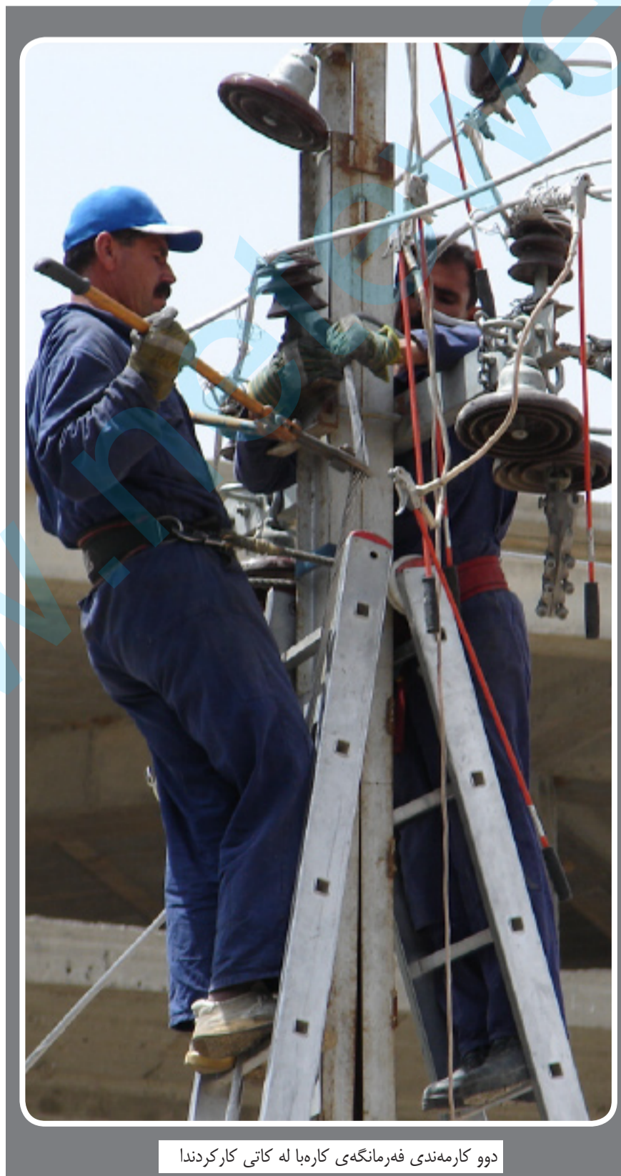
دوو کارمندی فهرانگه ي کاره با له کاتي کار کړندا

به پي نه و زانبار يانه ي ده ست روژ نامه که و توون، پيش زياد کړدنی نرخي کاره با