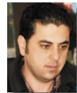
عیما د ر ه فعت

مهه سیتشم نیه بیکه مه خاوه ن گورچانه که ی موسا، به لام زهمینه بؤ گورانی له م جور له باره.