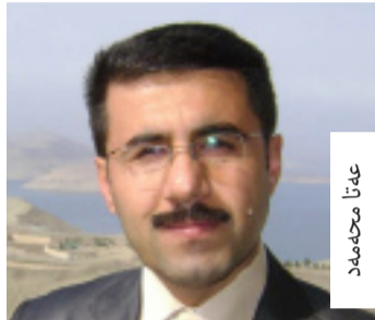
م. م. م.

ریڅراوی گه شه پیدانی مه دهنیه ت (CDO)، پنیوایه کاتیک فره لیستی هه بوو، نه وکاته خه لک به ئاسانی ده توانیت بریاربات بۇ هه لېږاردنی باشتین لیست یاخود باشتین