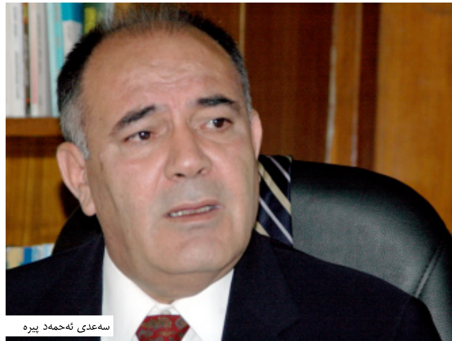
سه عدى ئه حمه د پيره

نمونه ئه و په رله ماتارانه له كاتى ياسا لى هه لپه زاردن پاريژ گاك ان چه نده زو وى له ده و رى به عسى يه كان كۆبو ونه وه، بۆ يه بوونى هيزىكو ئىمزا كردن ريكه و تنىكى له مجۆره، يه كى كه له و گر ده تىيان ه لى كه رىگر ده بيت له دوو باره بو ونه وه لى كار ه ساتى مرؤ بى وه ك ئه نفال و كىميا باران و گو رى به كۆمه لى كور ده كان، هه چ كه س ناتوانىت گه لى له كورد بكا ت كه بۆ چى زوو موافقه لى كرد، به لى ئيمه مارانگه سته بن، ئه زموون و مېژو وىه كى خرا پمان هه يه له گه ل حكومه تى عىراق، پيو بىستمان به گرهنى هه يه بۆ دوو باره نه بو ونه وه لى ئه و كار ه ساتانه.