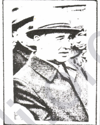
nel Sekreterliğe yeniden Mikhail Gorbaçov seçildi.

Ayrıca Kongre, daha önce tartışmaya açılan "program taslağı" nı görüştü. SBKP'nin 3. Programını onayladı. Parti Tüzüğünde değişiklikler yaptı. 12. Beş Yıllık Kalkınma Planını kabul etti ve 2000 yılına kadar ülkenin ekonomik ve sosyal gelişiminin ana hatları belirlendi. Yine Kongre, 15 Ocak'ta yapılan Sovyet silahsızlanma önerileri uyarınca, 2000 yılına dek tüm atom silahlarının yok edilmesi planını onayladı. Ve yeni MK'ni seçti. Yeni MK'de Ge-