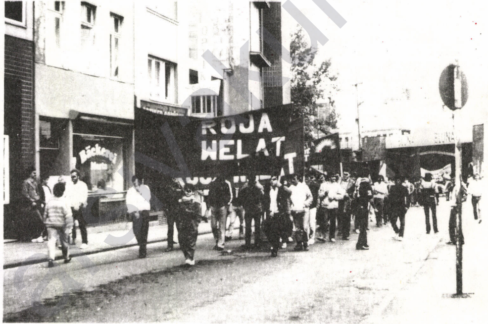
Köln'deki yürüyüşten bir görüntü

İnsan hak ve özgürlüklerinden hiç pay alamayan, fakat yapılan tüm bu, barbarlıklardan cifte kez nasibini alan Kürt ulusu bir bütün olarak yok edilmek isteniyor. Bir işçi arkadaşın belirttiği gibi, "Malatya'ya girişle birlikte insan kendisini bir harb alanında his ediyor". Bu bir benzetme