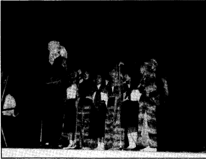
Di demek ji koroyê

Meha çuyin, meha Newrozê bû. Destpêka sala nû, hatina biharê... Wekê tê zanin Newroz, cejna gelên Iraniyan e. Her 21 ê Adarê da Kurd, Fars, Efgan, Tacik uhd. cejna Newrozê piroz dîkin. Tewqîma Newrozê bî bûyêra wê va destpêdike. Bî gora Tewqîma Newrozê isal sala 2596 an e.