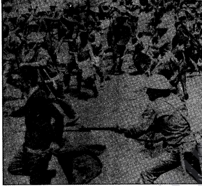
15-16 Haziran olaylarından bir görüntü

Sendikal hareket daha ilk dönemlerde kitlesel bir karakter kazanmakla kalmayıp, kapitalist sömürünün temelini yönelmeyi hedefleyen sınıfsal bir nitelik gösteriyordu. Bu ise, tekeli burjuvazinin tedirginliğini arttırıyordu. Burjuvazi baskı yöntemleriyle, işçi sınıfının gelişen ekonomik, politik ve ideolojik mücadelesinin kopmaz bir parçası olan sendikal savaşımını engelleyemediğini daha iyi kavriyordu, artık. Bu nedenle burjuvazi, baskı yöntemleri eşliğinde yasal olarak kurulan sendikaları ele geçirmek ya da sendikalarda sınıf işbirliği anlayışını geliştirerek onları denetim altına almaya yöneldi. Ve burjuvazi açısından Amerikancı sarı sendikacılık ilkelerine göre kurulan Türk-İş, bu iş için biçilmiş bir kaptandı... "Partiler üstü politika" aldatmacısıyla gelişen sınıf sendikacılığını saptırma