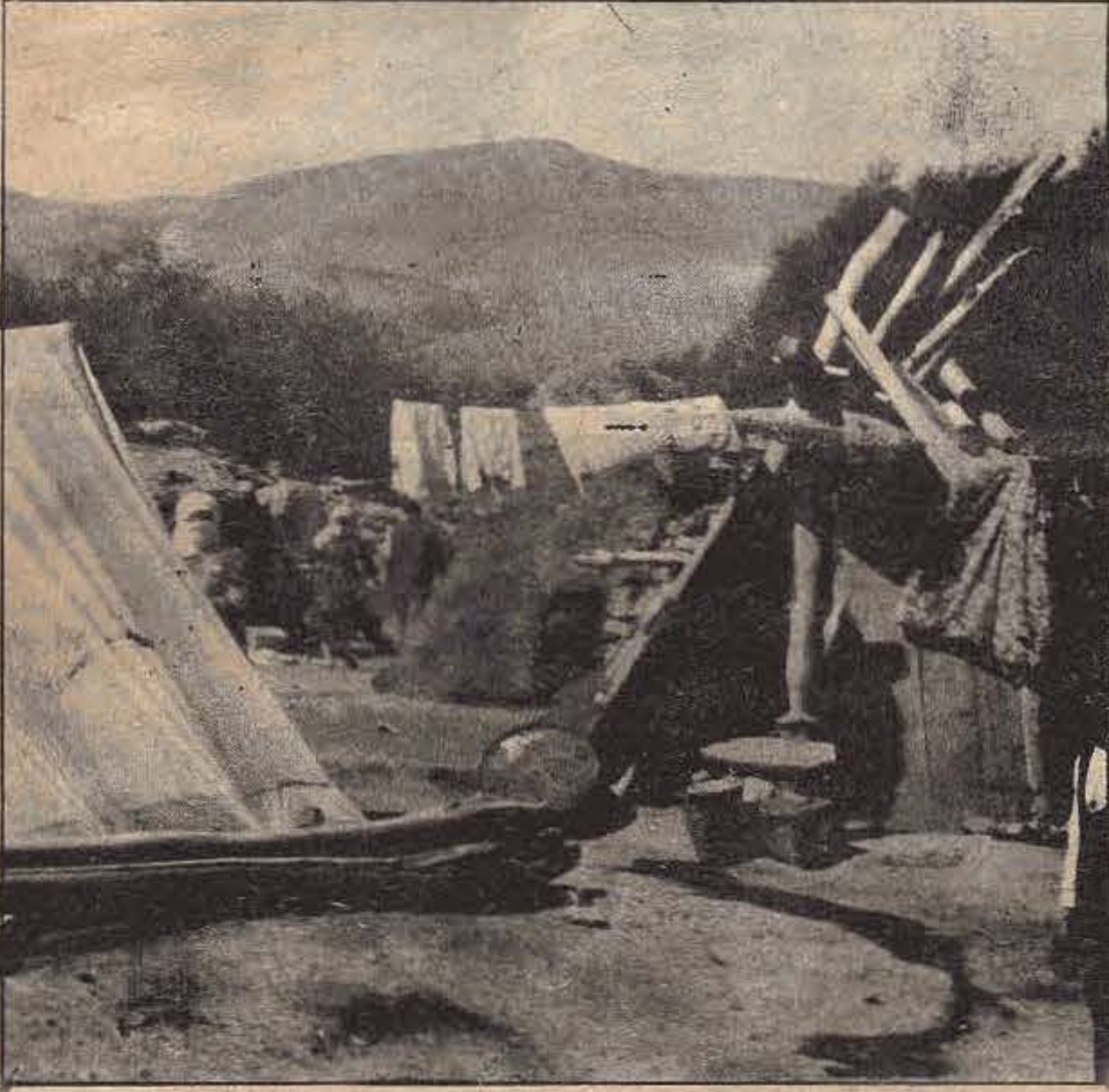
İkinci bir kış da bu çadırlarda geçirecekler... Sıcaklığın (-30,40) dereceye düştüğü bir kış...

Van'da deprem felâketine uğrayan emekçi halkımız bu yıl da kışı açıkta geçiriyor. Gericiler bu yıl da onu yaraları ve acıları baş başa bıraktılar.