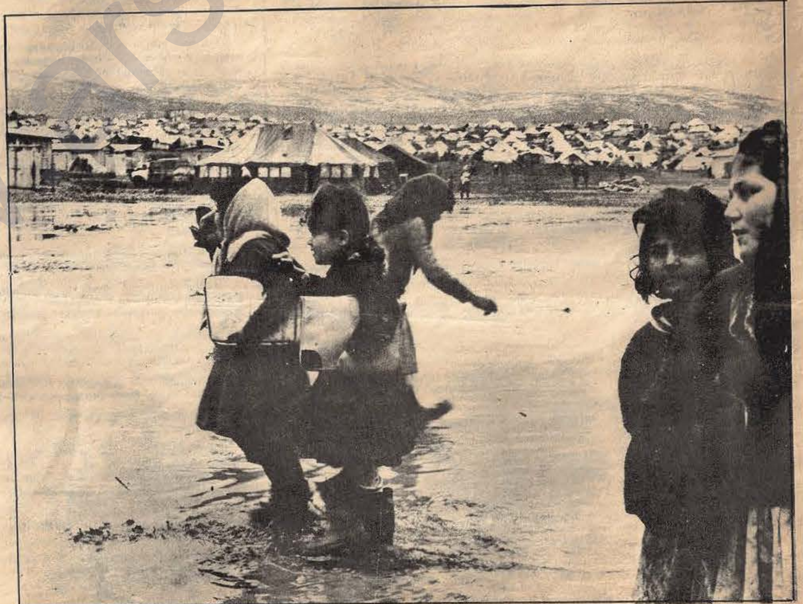
Bir Filistin kampında çocuklar okula gidiyorlar...

Filistin sorunu bakımından Orta-Doğu'da barışın sağlanması, hiç kuşkusuz, Carter ve uydualarının önerdikleri biçimde değil -çünkü bu halde Filistin halkının özgürlüğü hiçe inecek ve kurtuluş mücadelesi de devam edecektir-, bu halkın kendi kaderini, hiç bir kayıt ve şarta bağlı olma'sızın belirlemesi ile mümkündür.