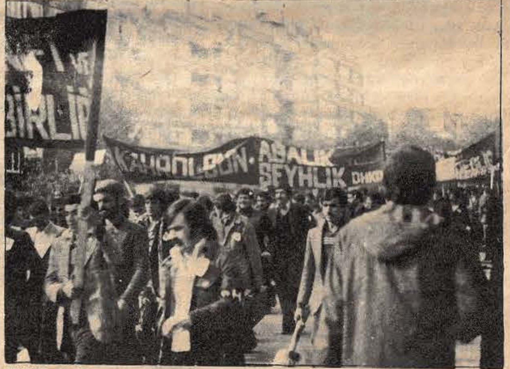
DHKD, 1 Mayıs yürüyüşünde...

Yönetim Kurulu kendi arasında görev bölümü yaparak başkanlığa Aydın Hasar, yazmanlığa Turgay Çakır, saymanlığa da Gani Cansever'i getirdiler.