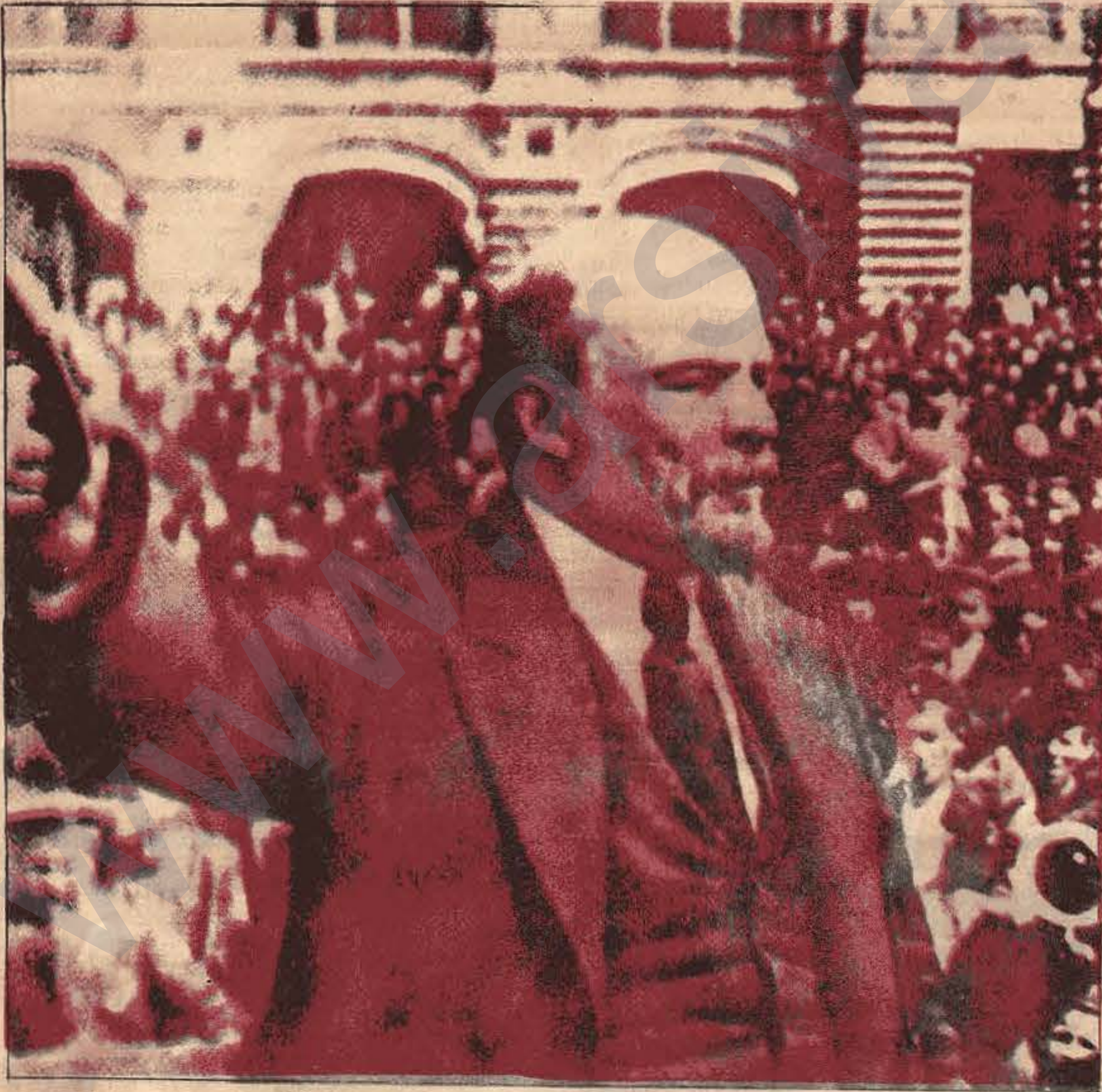
LENİN, 25 MART 1919'DA MOSKOVA'DA KİTLELERE HİTAP EDERKEN...

NOT: Bu yazı Sovyet NOVASTİ (APN) ajansından alınmıştır.