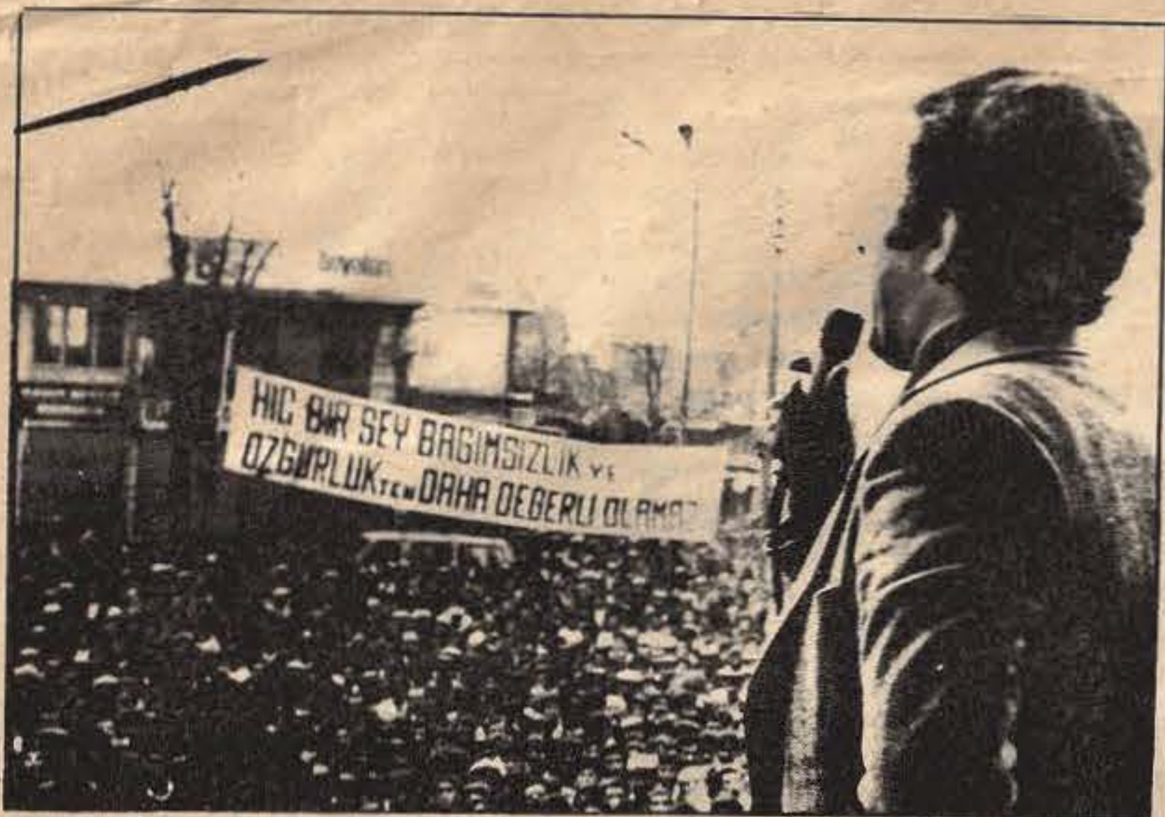
Mehti Zana 4 Aralık Mitinginde halka hitap ederken...