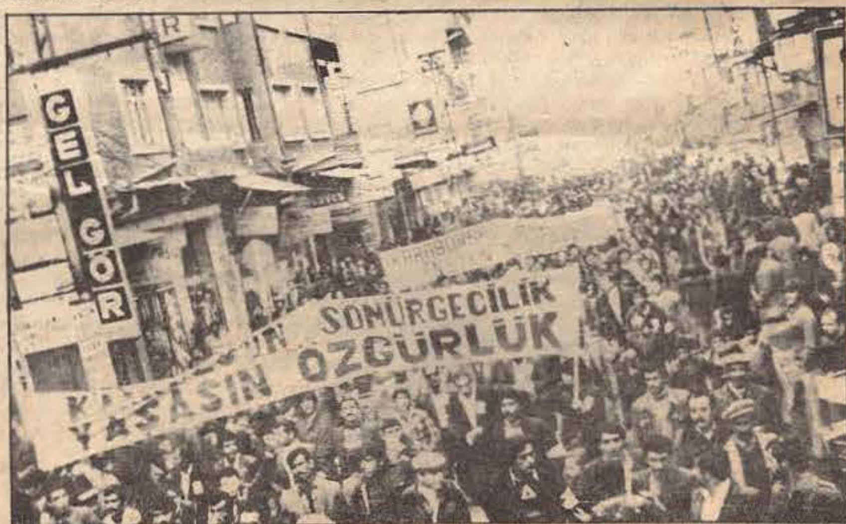
Kitleler 4 Aralık'ta "Kahrolsun Sömürgeçilik, Yaşasın Özgürlük!" diye haykırdılar...

Mehdi Zana, dört aya yakın bir süre Diyarbakır'ı ev-ev, kahve-kahve dolayarak halkla birlikte oturdu, onların sorunlarını dile getirdi ve onlardan destek istedi. Zana'nın karşısında sermayedarlar ve feodaller vardı ve onlar yüz binleri, milyonları harcıyorlardı. Mehdi Zana ise para-pula değil, halkına güveniyordu.