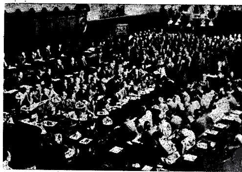
Bergehek ji mehema Mareşal Peten, di Parisê de. Peten gîha bû hela payega Mareşaliyê; û xelkê Frensî jê zehf hez dikirin, ew payedariya serfiraziya Ordîyên Frensîzî a 1914-1918-an bû. Di wî şerî de ew rabû destê elemanna gîrî û bê bexlî li welatê xwe kir û diwîya bû bête kuştin, lê her wekt gelek pîr e, ne hatiye mirandin; hela dawîya emrê xwe di hebsê de, wê bimîne.