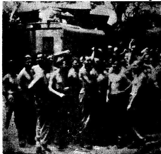
Di Rangûnê de, eskerên brîtanî, şabûniya xwe elam didin. Cenga japonan qediyaye, japon bêmeccal ketine erdê, û di pêşiya cihawê de, dergêhên sîh û aştîyê, azahî û serbestiyê vebûne.