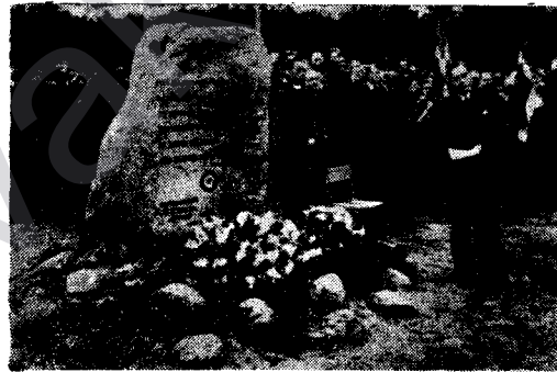
Xebatkerên denîmerkî ji bona balafirvanên inglîzî payedarîyek danîne, li ser vî kevîrî hatîge nivîsandin; ji bona xelastî û serbestîya welatê me, em şîkirdarî Xwedê ne. Ji peravên İngîlistanê 'balafirvanên brîtanî çek û sîleh, şîr û zencîr, bombe û mîtralîyoz anîne ji me re, da ko em bikarin, welatê xwe, erdê kal û kalîkên xwe, ji destê neyaran, ji destê zalîm û zedaran xelas bikin, wan balafirvanan canê xwe dane, heta ko em aza û serbest bibin; ew îro di erdê welatê me de, hatine veşartin; Xwedê rûh û gîyanê wan şa bike.