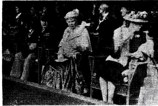
Hiş û bedenên xortan, divê xurt û saxlem bin; ev, der hemî welatên pêşvekefî, qeydeyê heja û bi qîmet e. Diya Kralê Britanya Mezin bixwe tê erdê ko tede leyistokên bedenparêziyê çêdikin û bi hatina xwe nav di xortan dide, da ko xweş bixebitin û heja bûna xwe şani mêzkeran bidin.