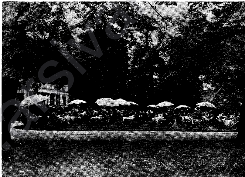
Brîtanya Mezin bi park û bexçeyên xwe, bi parîz û çemenzaran bi nav û denge. Giyayên wê erdê di rengê keskekî tarî de ye û çav jê gelek hez dike. Bexçeyek ji yên dora Londrê. Rûniştimanên payetextê brîtanî nênazê piştî nîro, di van bexçeyan de rûdinin, mûsiqî di bi hisin, û çaga xwe vedaxwin û di wê navê de, zaroyên wan li ser çemenan dileyizin, bihna xwe vedikin.

Du keçên di wî hene; dota wî a mezîn bertextê Inglîstanê ye; piştî bavê xwe heke Xwedê xwest, ewê rûne ser textê Brîtanya Mezin.