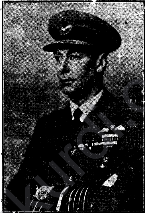
Kralê Ingilîstanê û Şahînsahê Hindîstanê Xwedî Tac û Text CORC VI.