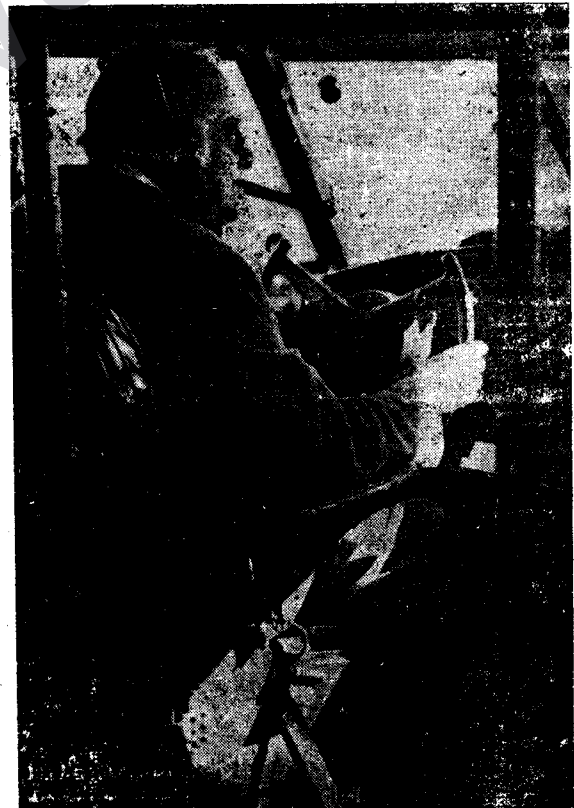
S erekwezîrê Bîrtanya Mezin M. Çorçîl Balafîrvanekî Hêja, Bi Qîmet e.

STOKHOLM— Danezana elemanî a piştî nîro mûkir tê ko di bakurê Krîvøy Rogê de yekineyên Ordîya Sor xetên elemana neqeb kirine.