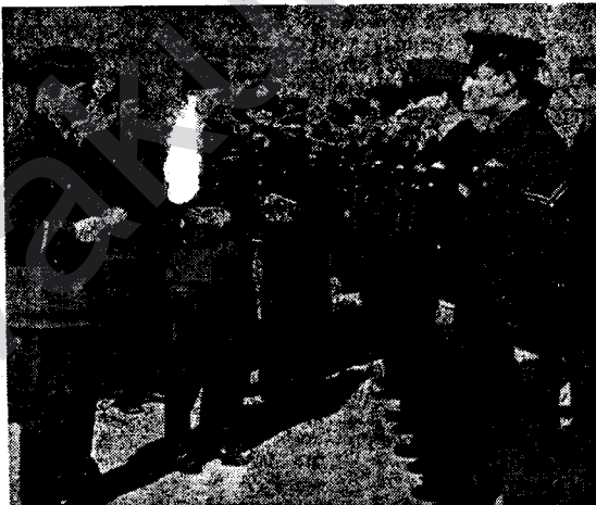
Xort in, ciwan in, dest bi karîne dijwar dikin, û bi mîraniya xwe berevaniya heq û kewneyên cihanê dikin.