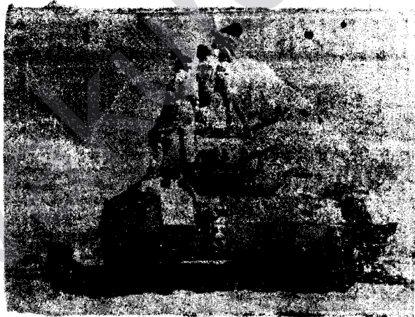
Eskerên Hevalbendan Hilkişiyane Ser Tangekê û Li Dora Xwe Dinêrin.