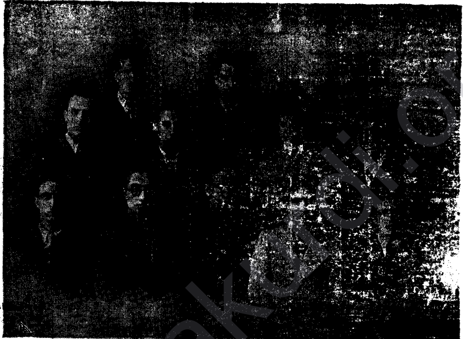
XORTÊN ME EN TAXA KURDAN LI ŞAME BI ZANIN, XEYRET Û PEŞVEÇUNA XWE HEJA NE.