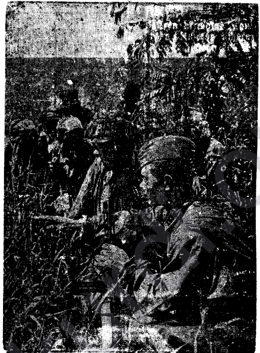
Leşkerên Hevalbendan Di Nav Devî û Daristanan De Cengê Dijîna Dikin.