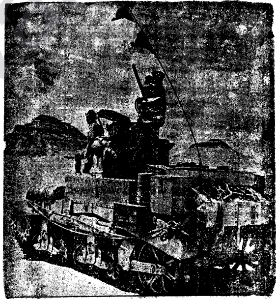
Tangine Mezin, Tangine Giran, Bi Hezaran Tang Dirêji Neyaran Dikin û Li Rohelat û Roavayî Zora Wan Dibin.

Ji zelamekî pîrsî: go kanî mehkeme li kû ye?