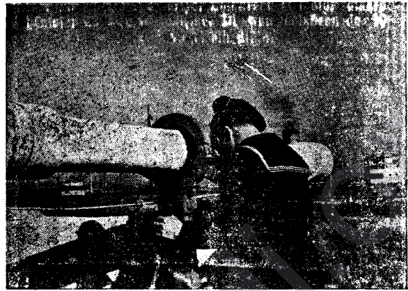
Deryavanek Bi Dûrbîna Xwe a Mezin Karê Nobetdariyê Pêk Tîne.