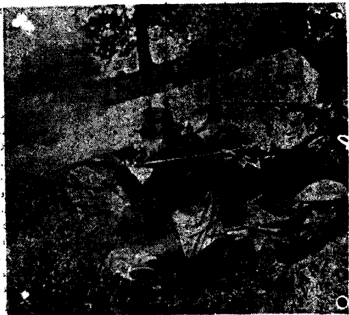
Welatparêz Bi Her Textî Silehên ko Dikevin Dest Cengê Neyarên Welatê Xwe Dikin.