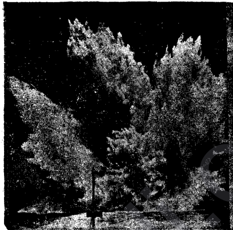
Bombeyeke Mezin Feqiyaye u Pê Du û Dûman û Qev Qiyamet Rabûye.