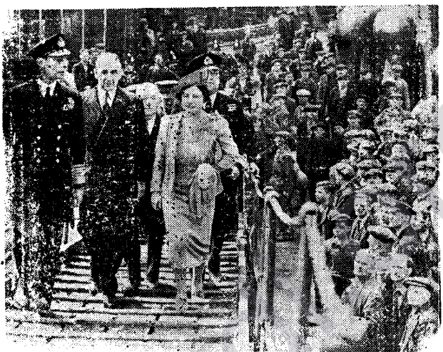
Xwedî Tac û Text, Hikimranên erd û Kişweran Kral û Kralîça Ingilistanê