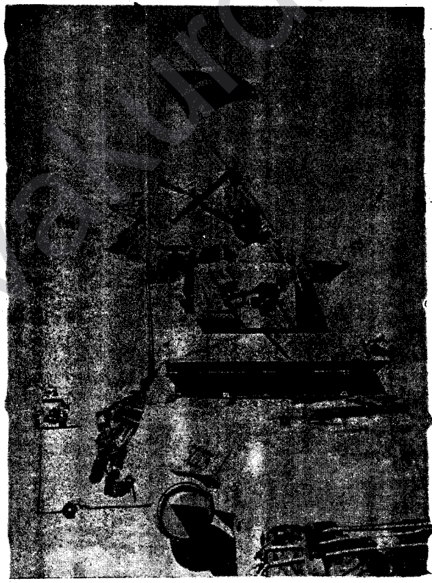
TANGEKE FRENŞIZÎ PÊŞ VE DIÇE

LONDRE- Leşkerên Yugoslavî ketine Mecaristanê û tede gerê neyaran dikin. RIO DE JANEIRO - Bi awakî resmî didin zanîn: balafireke brêzilî ji nişka ve bi ser noqaveke dijmin de girtiye û ew bin av kiriyê. LONDRE- Komîte britanî a arîkariya Ordîya Sor, ya ko dibin sermîyanîya Sîtiya Çorçil de ye 4.00.000 (çar milyon) lîreyên inglîzî kom kirine, piraniya mirovên ko ev pere dane xebatker in. MOSKÛ- Hikûmeta Sovyetistanê ji 118 mêrxasan re payeya Egîdiên Sovyetistanê dane, di nav wan de esker serbend û 3 general hene. Ev egîden he hcmî, di şerên Dnieprê de mêrxasiya xwe şanî neyaran dane. LONDRE- Qerargeha leşkerên Kenadî a mezin li Londrê e- lam'dide ko ji panzde serbend û şerevaniyên Kenadî re nişanî frensîzî a mezin Croix de Guerre hatiye dayîn. LONDRE- Wîlo dixuye ko serekên tînyanî ên liberal û de mokrat mîna kont Sforza û Krose na xwazin di bin emrê Kralê Ital- yayê Viqtor Emanuel de, xidmeta welatê xwe û arîkariya hikûmeta Badogliyoyê bikin. Text û Tacberdana Kralê Italyayê bi awakî zor- aîveyê aştîneyê.