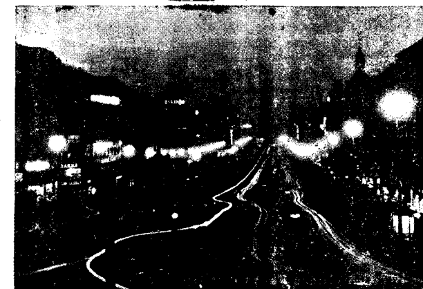
Bergehek ji yê payetextê Çekoslovakyayê Prag. Ev sûret bi gev hatiye girtin, gasingeha St. Venseslasî û şehreyên dora vê Gasin, gehê şanî me dide.

LONDRE— Meha borî refên emêrikanî 4.690 ton bombe avêtine hejagehên elemana û 784 balafîrên elemanî xistine erdê.