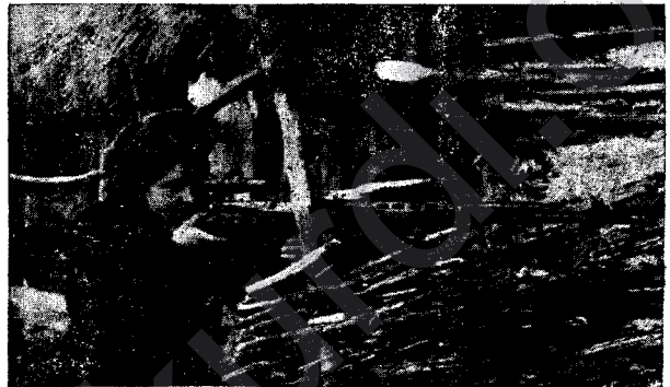
Keç û dot û jin bi hezaran çûne Sovyetistanê û tenişta eskerên rûsî de şerê neyaren welatê xwe dikin.

Lêbelê, sernivîştî wan a reş wilo xwest, piştî bîst û pênc salên azahî û serbestiyê, berî pênc salan jî nû ve ketin bin destê dijminan, hikûmeta Çekoslovakî hatiye rakirin, rojnama û kovar, medrese û dibistanên wan hatine girtin. Di pêşiya vî tiştî de miletê Çekoslovak çî kir; sûret û wêneyê: jêrîn pêş me dikin.