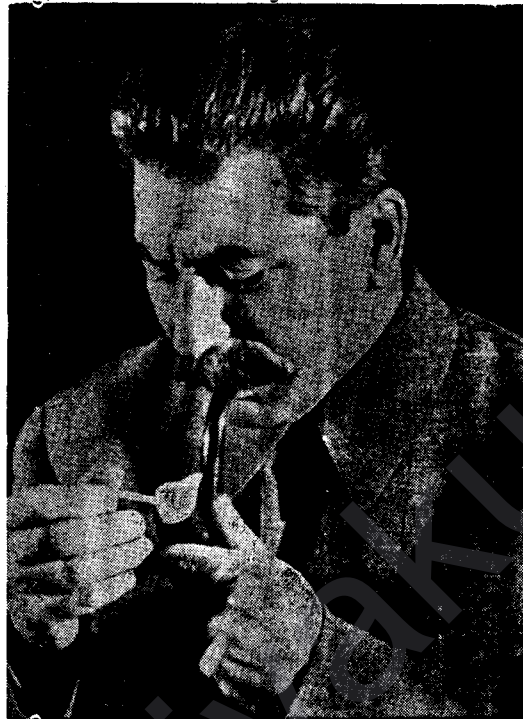
Bavê Miletên Sovyetistanê Mareşal STALIN