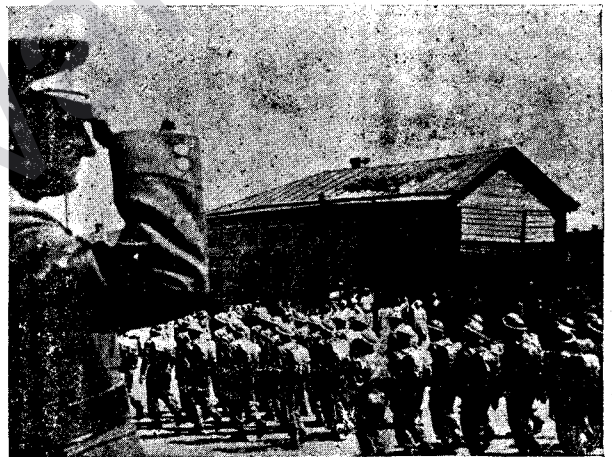
Pir û civan ketine eskeriyê. Serdarê Çekoslovakî General Ingr silav li eskerên Çekoslovakyayê dike.