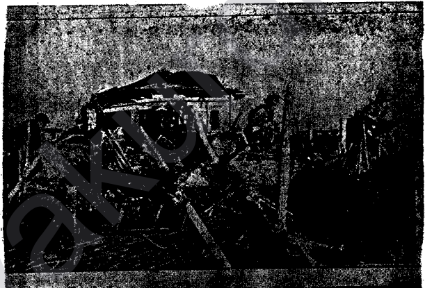
Bajarê Rûsî ê Egid Stalîngrad, Kûçe û Kolanên Xwe De Zora Dijmîran Biri Bû. Çeper û Kozîkên Dora Stalîngradê.