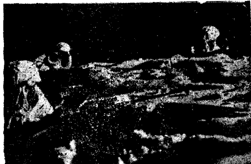
Kewte û Sedmêrên Ordiya Sor, Bi Şev Karê Xwe ê Dîdevanî û Nobetdariyê Pêk Tînin.