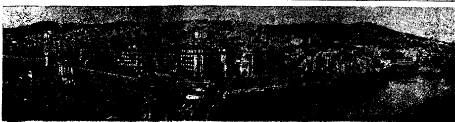
CEZAYİR, ŞARİSTANA SPİ, BAZARA CİHANA RESİKAN