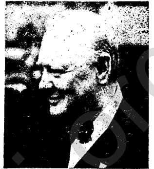
SEREKWEZÎR Mr. ÇORÇIL