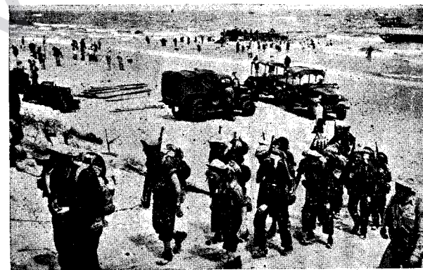
ESKEREN EMERİKANI PÊŞ VE DIKEVIN