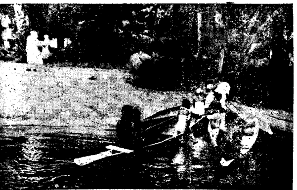
BEXÇEYÊN XESTEXANA LAMBARENÊ