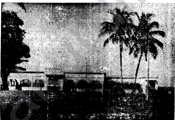
LIBERVIL : AVAHİYÊN BAZARÊ