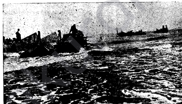
TANGEK BERÊ XWE DAYE BEJÊ.