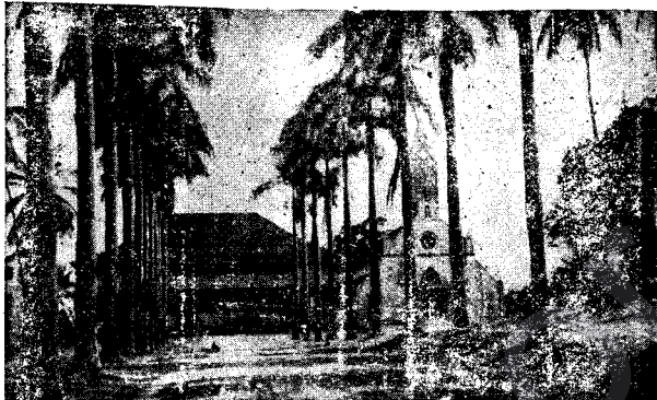
GABON. LIBERVIL.: DESTPÊKA KONGOYA FRENSIZÎ.