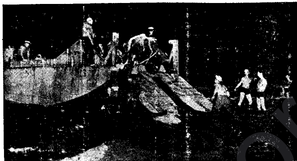
QIWETÊN HEVALBENDA BERÎ SALEKÊ DERKETINE ERDÊ EFRIQAYÊ