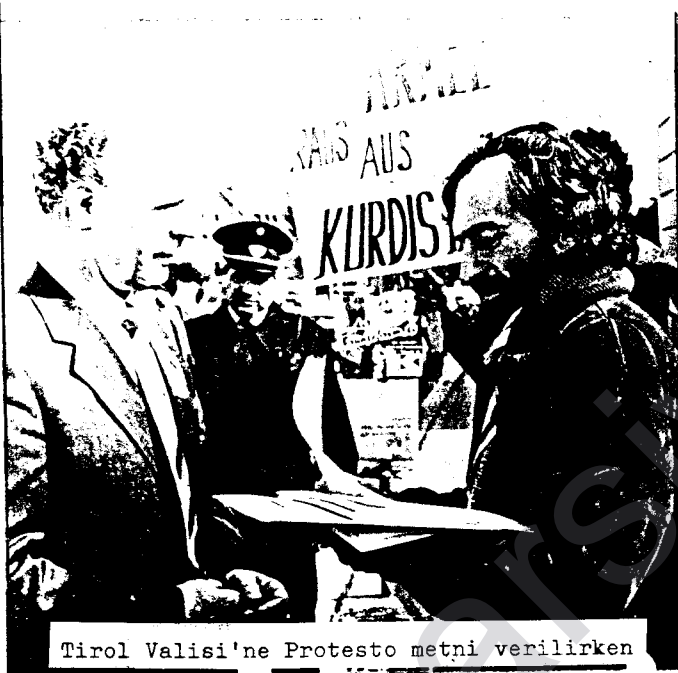
Tirol Valisi'ne Protesto metni verilirken

Sömürgeci T.C.'nin halkımıza karşı sürdürdüğü yok etme politikası gereği, Kürdistan son dönemlerde çeşitli saldırılara sahne oldu. 4 Mart'ta, Güney Kürdistanı uçaklarla bombalılarak sivil halktan yüzlerce insanı katleden faşist T.C., diğer yandan da yeni Mecburi İskan Yasası ile halkımızı sürgüne göndermek istemektedir.