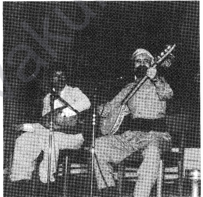
Şıvan, Danimarka'daki Newroz'da

Sömürgeci T.C.'nin, halkımıza karşı saldırılarını (Güney Kürdistan'ın bombalanması, Mecburi İskan v.b. gibi) sıklaştırdığı bir dönemde, Newroz'un gerek yurtiçinde ve gerekse yurtdışında kutlanması, sömürgecilerin yüreğine korku saldı.