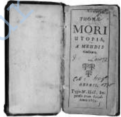
Utopya , Thomas More, çapa pêşin, 1663

Ji bilî Thomas More; Machiavelli, Thomas Hobbes û T. Campanella jî, di sedsala 16. û 17. de, wekî xwedî ûtopyayên klasîk têne zanîn. Berhema Campanella ya bi navê Welatê Rojê ji aliyê mijarê ve ya herî nêzîkî ûtopyaya Thomas More e. Ji sedsala 17. û vir ve ye, Cyrano De Bergerac bi berhema xwe ya bi navê Dîroka Pêkenî ya Dewletên Heyvê , Jonathan Swift bi