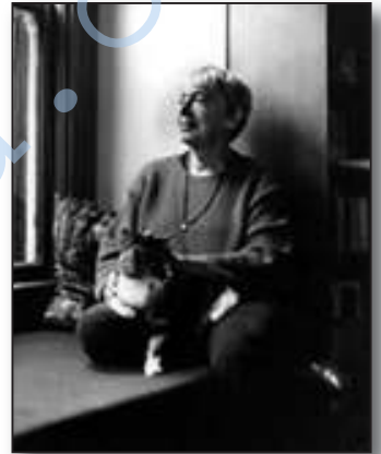
Ursula K. Le Guin

Piştî ku kompîter çêdibe û teknoloji bi her awayî dikeve jiyana mirovan, di warê honaka zanistî de jî berhem xwe nû dikin û her wiha wêjeya Honaka Zanistî êdî bandorê li sînemayê jî dike û gelek filîmên balkêş çêdibin. Ji vê demê re jî Dema Honaka Zanistî ya Hemdem (Ji sala 1980'yî û vir ve) tê gotin û heta îro bi gelek nivîskaran di nava wêjeya cihanê de derdikeve pêş.