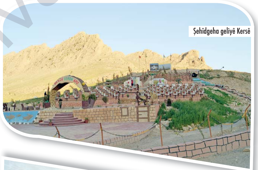
Şehîdgeha geliyê Kersê

de wek Çilmêran tê zanîn û bilindahiya wî 1.463 metre ye. Dirêjahiya çiyê 100 kilometre ye. Gelek gelî û newal di nava çiyê de hene û ber bi Başûr û Bakur ve xwe dirêj dikin. Li çiyê bi piranî darê berû hene. Lê ji ber ku gelek caran bûye navenda êrişan û hatiye şewitandin daristanên wê gelek kêr mane. Di warê erdnîgariyê de di xaka başûrê Kurdistanê de ye û li nêzî Rojavayê Kurdistanê ye. Çar aliyê Şengalê bi gundan xemilîne. Ji berê de ev der weke navenda bazirganiyê hatiye bikaranîn. Li aliyê Başûr (Qiblet) û Bakur (Şemal) du xanê bazirganiyê lê hebûne. Xelkê herêmê, berê sewalên xwe dianîn van xanan. Li aliyê Bakur Xanesorê, li aliyê Başûr jî Xana Şawaniyan heye. Xan weke cihê seknê û bêhnvedanê dihatin bikaranîn. Dema bazirgan dihatin tevî sewalên xwe lê diman. Pirraniya perestgeh û pîrozgehên civakê li vê deverê ne. Li aliyê Başûr Qibên Amadîn, Miheme Reşa, Şêx Hesên û Melek Fexredîn hene. Ev ziyaret, zahmen li ber wan hene û xelkê herêmê diçin serdana van deveran û ziyaretî dibin. Ji aliyê Bakur ve jî Şêxê Mihema, Xatûna Fexra, Pîra Fat, Şêşim, Şêxmend, li Geliyê Kersê Şêbilqasim, Şerfedîn, Pîrê Ewran, Şêşim, Şêx Berekat û Amadîn hene. Her wiha gelek kaniyên weke çem diherikin jî hene, weke mînak li Başûr Kaniya Solax, Kaniya Şingal, Kaniya Kizilkent. Li aliyê bakur jî Kaniya Barê, Kaniya Kersê weke Çemê Kersê jî tê naskirin. Dîsa gelek Kaniyên biçûk yên, weke Kaniya Leylê, Kaniya Şêb û Kaniya Hisênok hene.