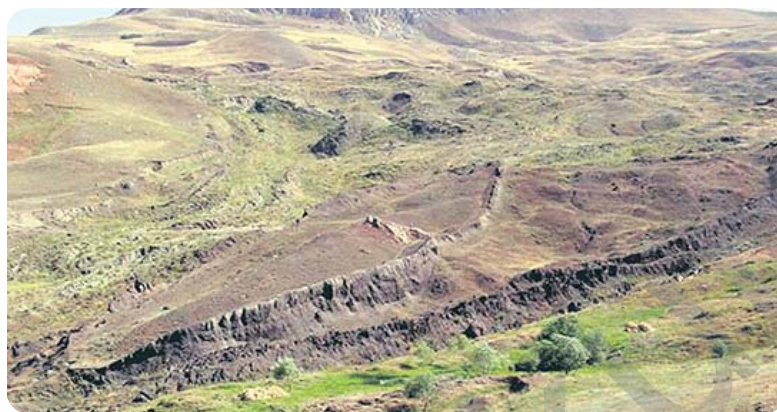
Ev cihê sefîneyê ye, yanî cihê ku xelk bawer dixe keştiya Nûh lê daniye.

Çiyayê Cûdî piştî ku ji sefîneya Nebî Nûh re bûye cih û war, weke xaka dewama mirovahiyê hatiye qebûlkirin. Insanetî li Cûdî, li Mezopotamyayê ji nû ve