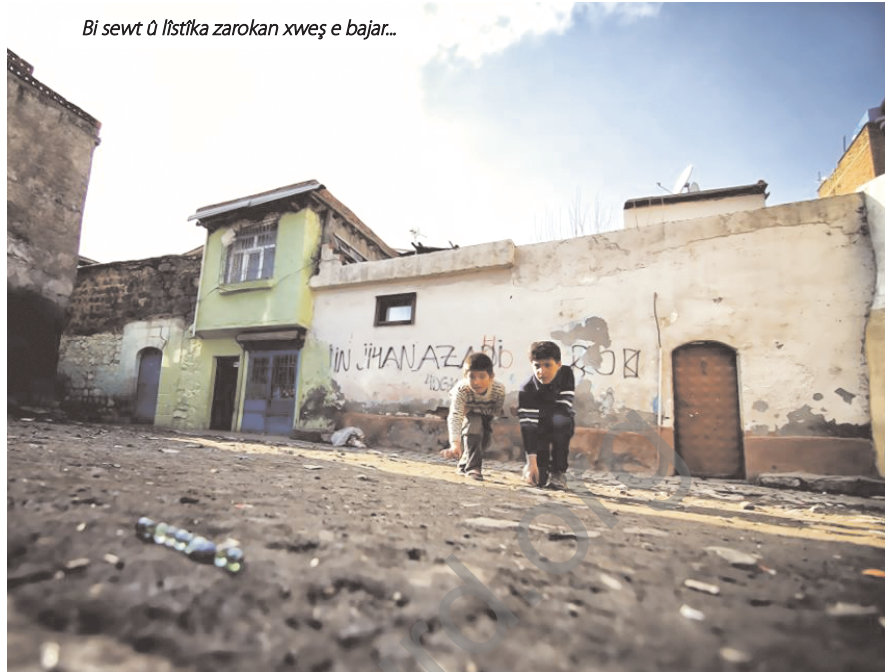
Bi sewt û lîstîka zarokan xweş e bajar...

Herausgeber: Medya Presse-und Werbeagentur GmbH Hans-Böckler-Str. 16 63263 Neu-Isenburg Geschäftsführer: İzzet Akcin Ver. Redakteur: Özgür Reçberlik politikart@yeniozgurpolitika.org