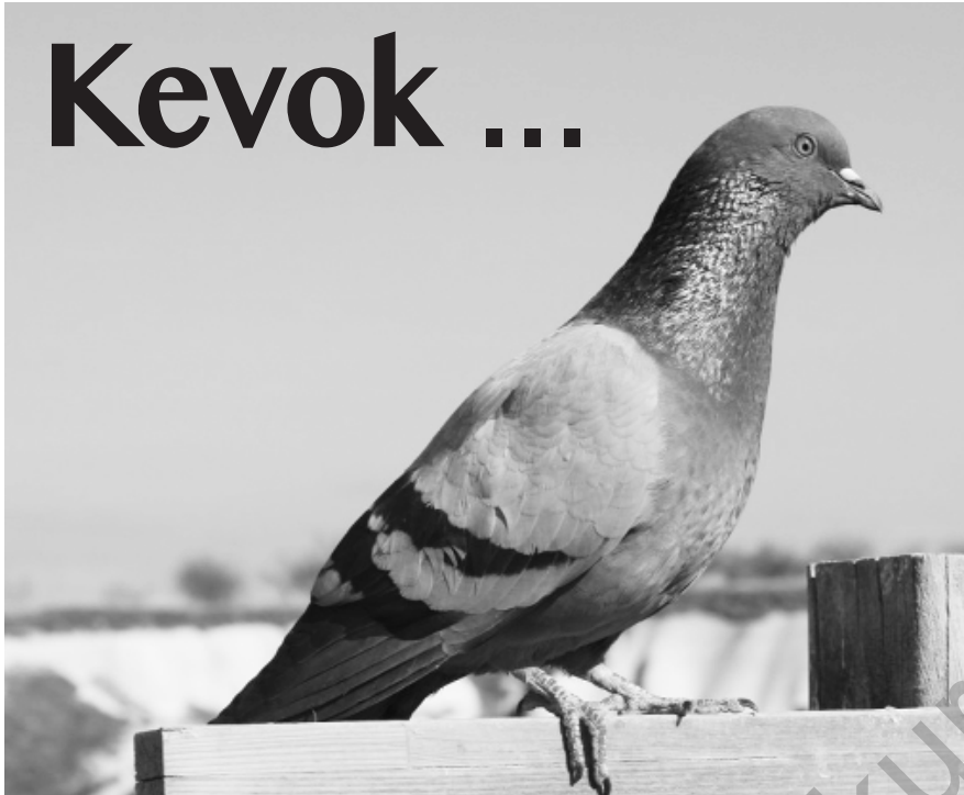
► A.Selam BARAN*

B i cop û kalasan ve ketin hundirê qawîşê û bi xirecir û barebar qir didan: