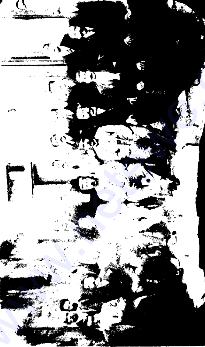
Dersim aşiretlerini temsilen 1926'da Ankara'ya giden heyet.