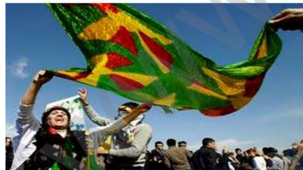
Newroz bi çêseke mezin hate pîroz kirin . 3

Amed (Pêşketin): Li bakûrê Kurdistanê li gel hemû astengiyên dewleta Tirk Kurdistanî bi çêseke mezin cejna neteweyî ya Kurdan Newrozê hate pîroz kirin. Li hemû Kurdistanê jî her sal zêdetir beşdariya gel çêbû. Ji roja 17ê heta 21ê zêdetirê 4 mîlyon Kurd li qadan bi avayekî girseyî bi rengê neteweyî Newrozê pîroz kirin. Li Diyarbekirê nêzî 1,5 mîlyon kes hatin cem hev û tu bûyer jî neqewimî. Organîzasyonake ewqas mezin jî aliyê raya giştî ya cîhanê ve nehate ditin. Di medyaya cîhanê de di çend weşanan de bi avayekî bir kurt behsa Newroza li Amedê û bi giştî li Kurdistanê hate kirin. Nûçeyên ku derketi bûn jî tev agahiyên şaş hatibû dayin û hejmar wek 100 hezar hatibû nişandan. Dewama nûçe di rûpela 3'an de