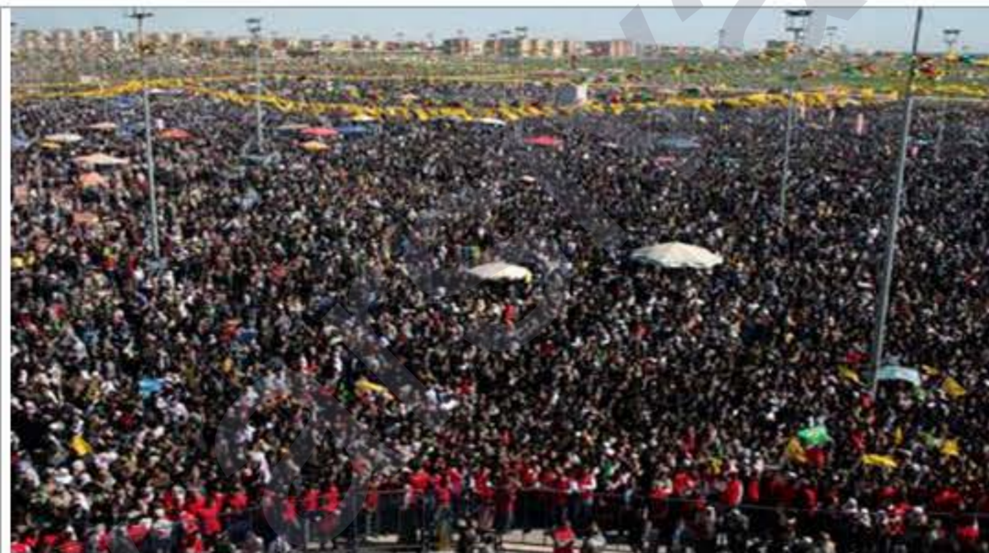
Amed di Newroza xwe de ji hemû cîhanê re got; Hesabên şaş nekin» r.3