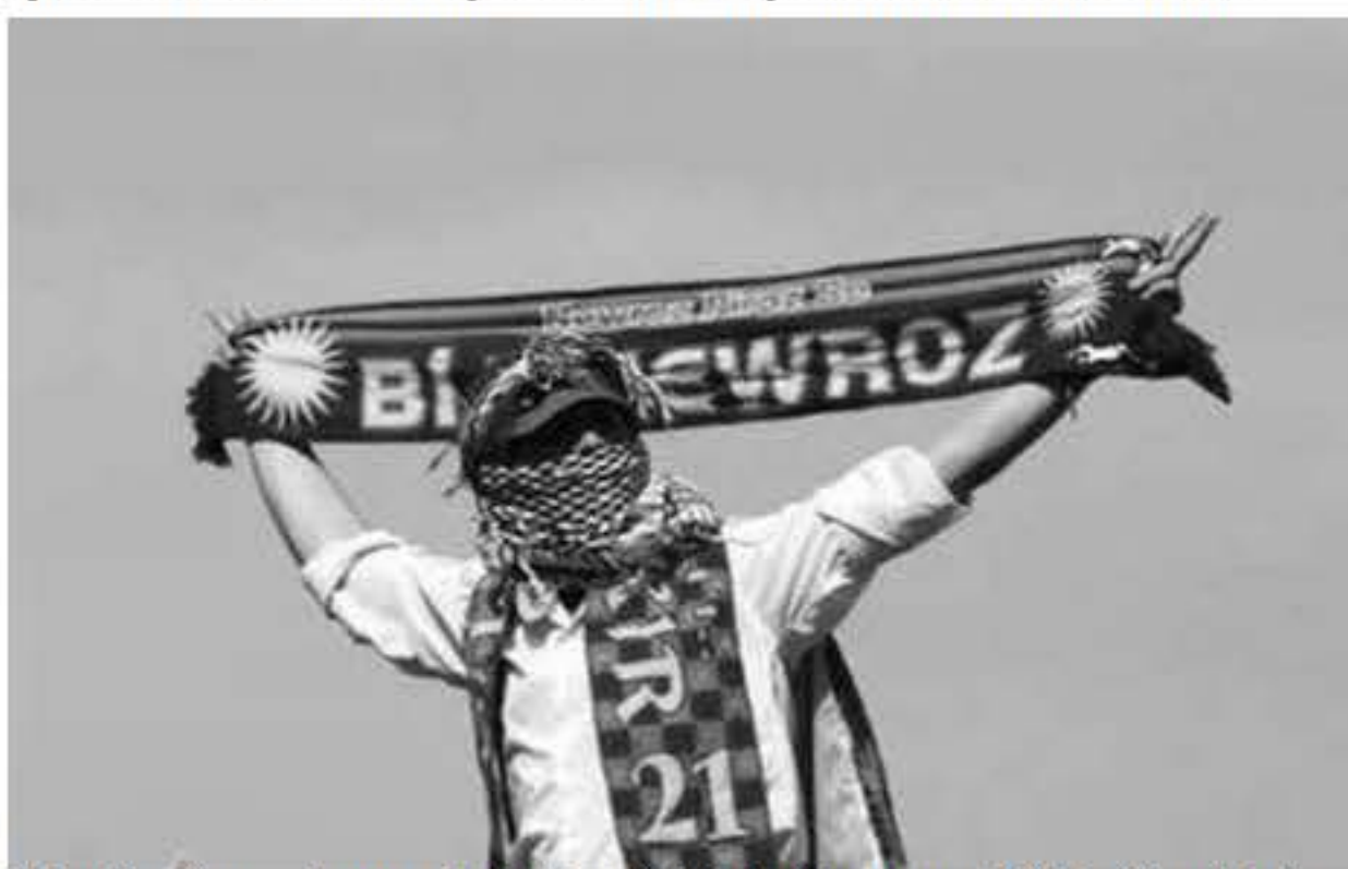
Li Ewrûpayê meşeke normal di BBC an jî CNN de dibe manşet. Lê 4,5 mîlyon Kurd nehate ditin. Kurd Newrozê wek cejneke neteweyî piroz dîkin.

Li Diyarbekirê nêzi 1,5 mîlyon kes hatin cem hev û tu bûyer ji neqewimî. Organîzasyonake ewqas mezin ji aliyê raya giştî ya cihanê ve nehate ditin. Di medyaya cihanê de di çend weşanan de bi avayeki bir kurt behsa Newroza li Amedê û bi giştî li Kurdistanê hate kirin. Nûçeyên ku derketi bûn ji tev agahiyên şaş hatibû dayin û hejmar wek 100 hezar hatibû nişandan. Di medyaya cihanê de çalakîyên ku 50 hezar kes tîcîm hev jî manşetan tê dayin, teqîneke biçûk