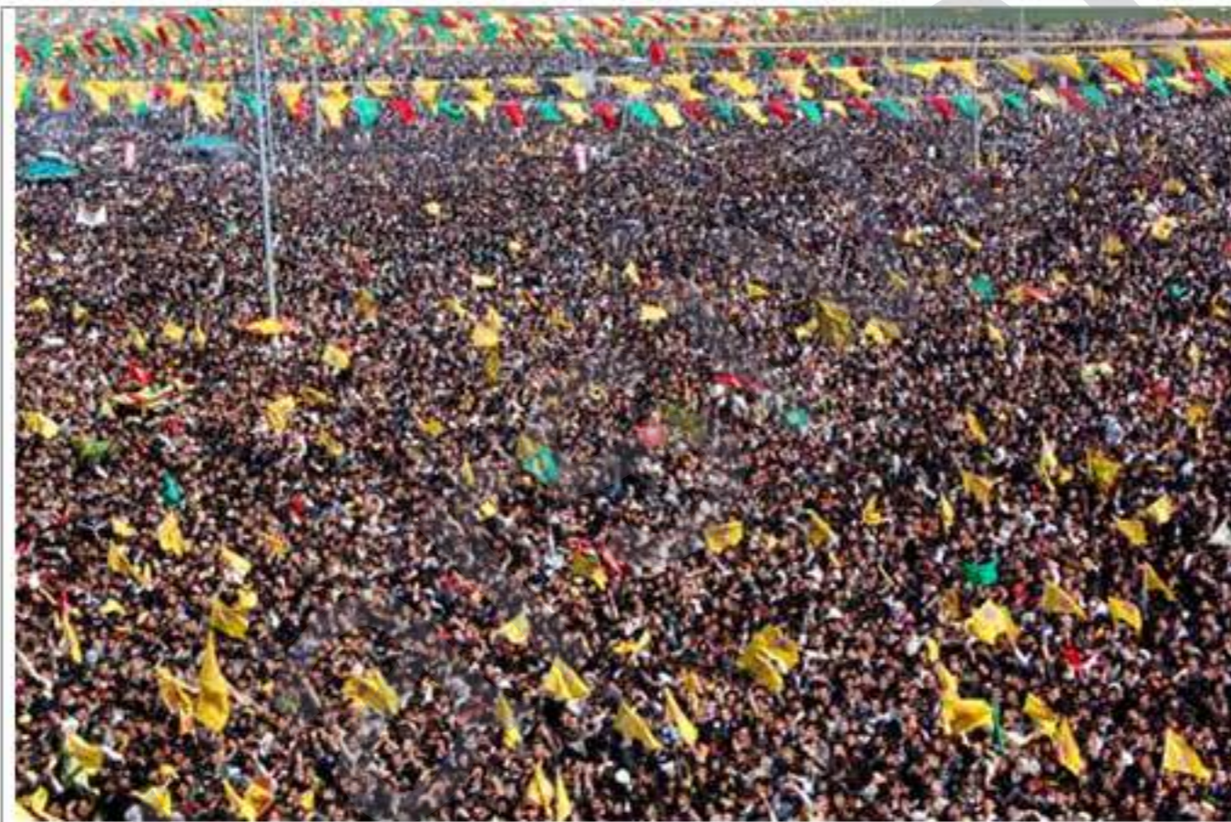
Li Kurdistanê coşa Newrozê destpêkir » r.3