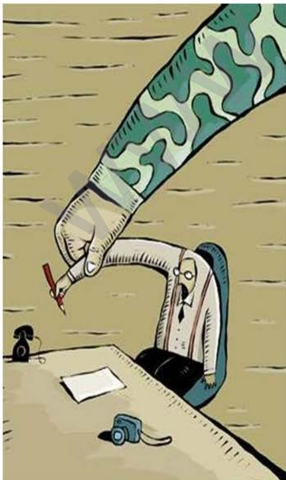
ARTEŞA TIRK Û MEDYAYA TIRKÎ