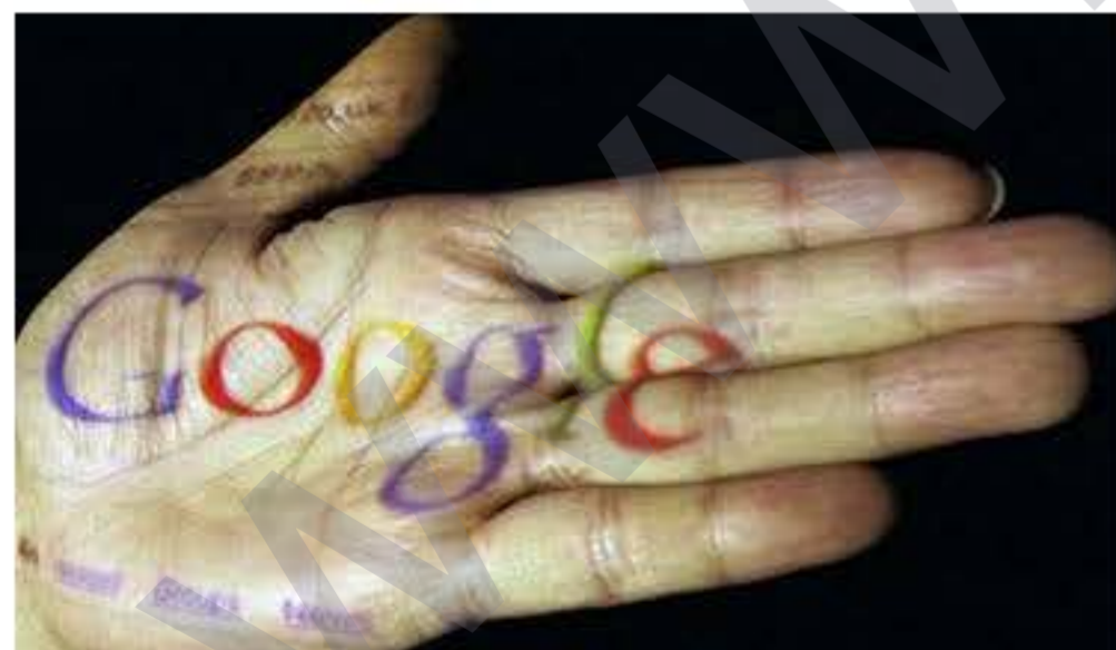
Gelo Google dibe Kurdî. R8

Li aliyekî asimilasyona giran a dewleta Tirk bi riya perwerdeya Tirkî û televîzyonên Tirkî êdî rewş wisa bûye ku Kurd xwe bixwe ji asimilasyonê dike. Malbat bi zimanê Kurdî naaxifin, zarokên xwe hînî Kurdî nakin. Ciwanên Kurd ku tede beşeke mezînanên Kurdan de gellek qels e. Didin ji zimanê Kurdî bikarnayînin. Divê bikaranîna Kurdî ser qûtîyên çopê a şaredariyên Colermeg û Şemzînanê bo hemû şaredariyên Kurd bibe minak. Dewama nûçe di rûpela 3'an de