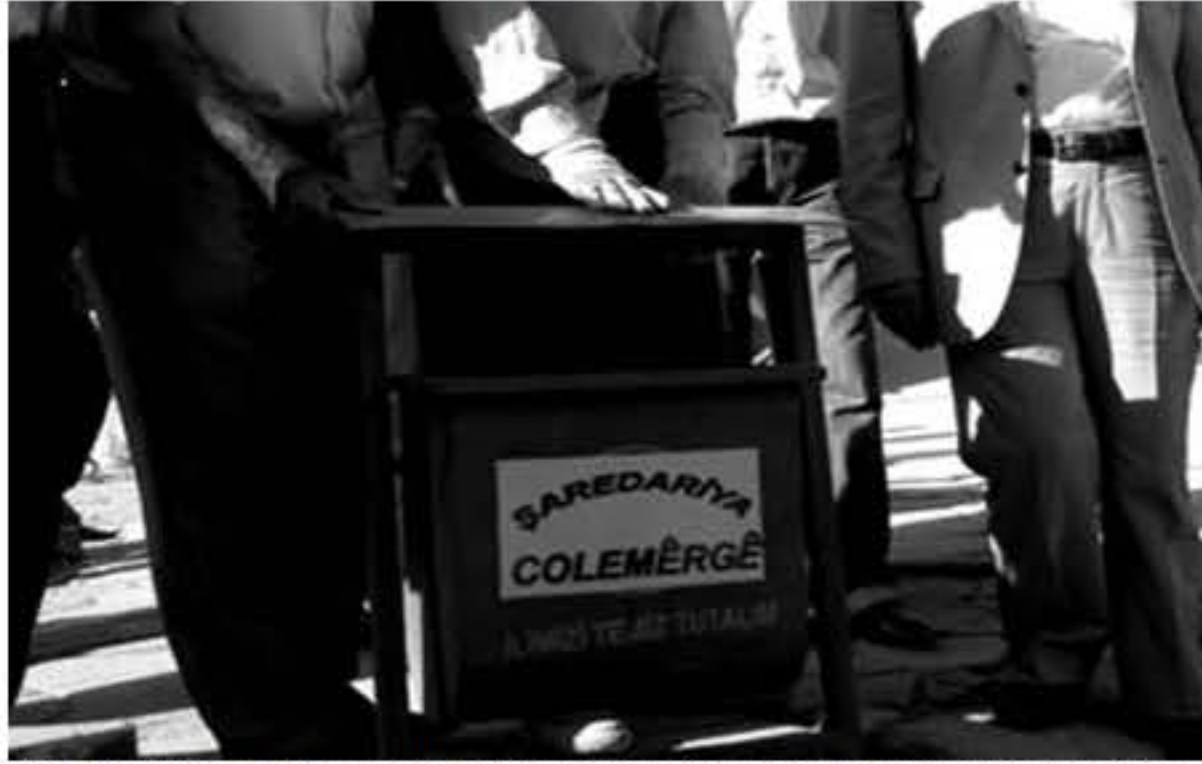
Divê bikaranîna Kurdî ser qûtîyên çopê a şaredariyên Colermeg û Şemzînanê bo hemû şaredariyên Kurd bibe mînak

gellek qels e. Li aliyekî asimilasyona giran a dewleta Tirk bi riya perwerdeya Tirkî û televizyonên Tirkî êdî rewş wisa bûye ku Kurd xwe bixwe ji asimilê dîkin. Malbat bi zimanê Kurdî naaxîfin, zarokên xwe hinî Kurdî nakin. Ciwanên Kurd ku têde beşeke mezînan ku xwe wek welatparêz nişan didin ji zimanê Kurdî bikarnaynin.