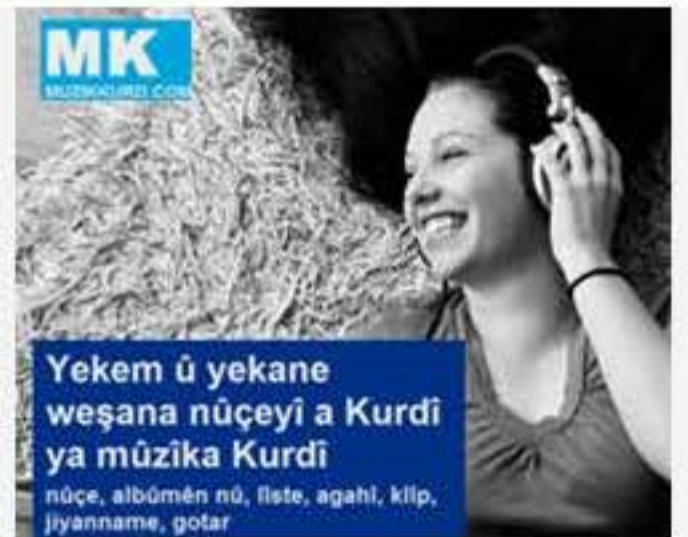
Yekem û yekane weşana nûçeyî a Kurdî ya mûzîka Kurdî nûçe, albûmên nû, fîste, agahî, klîp, jiyanname, gotar