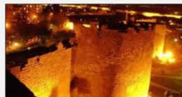
Kurdistan Dergûşa Şarîstaniyê Roniya Pêşarojê

di mehên li pêşîya me de, piraniya kompaniyayên pêrabûnên pêwîst ji bo parastina karkerên xwe bapêjin da ku neçar nebin wan ji kar bavêjin. Hin çavkaniyên Biroya Federal ya Kar li Almanya dîr dibînin ku bi armanca vedîtina karekî din, karker dest ji karê xwe yê niha berdin. Bi gor wan daxuyaniyên ku di malpera DW de hatine weşandin, wê bazara karî daxistî bimîne û rêya vebûna wê ji ne diyar e.