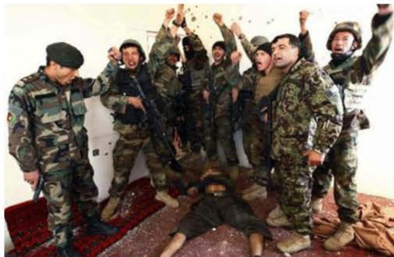
Li Efxenîstanê her roj bi dehan kes jiyana xwe ji dest didin û şer û pevçûn bûye perçeyeke ji yana rojane. Ev wêne jî rastîya Efxenîstanê radixe berçavan

dewletê yên polis û leşkeran de şer dest pê kir. Berdevkê Talîbanê li ser bûyerê daxuyani da. Di daxuyaniyê de aşkera kir ku 20 mîlîtanên wan kembara intiharê li xwe pêçane û ketine nav wezaretxaneyên Qabilê. Hate ragihandin ku li navenda bazirganiya dan û standîne wesayîte bombe lê barkirî hat