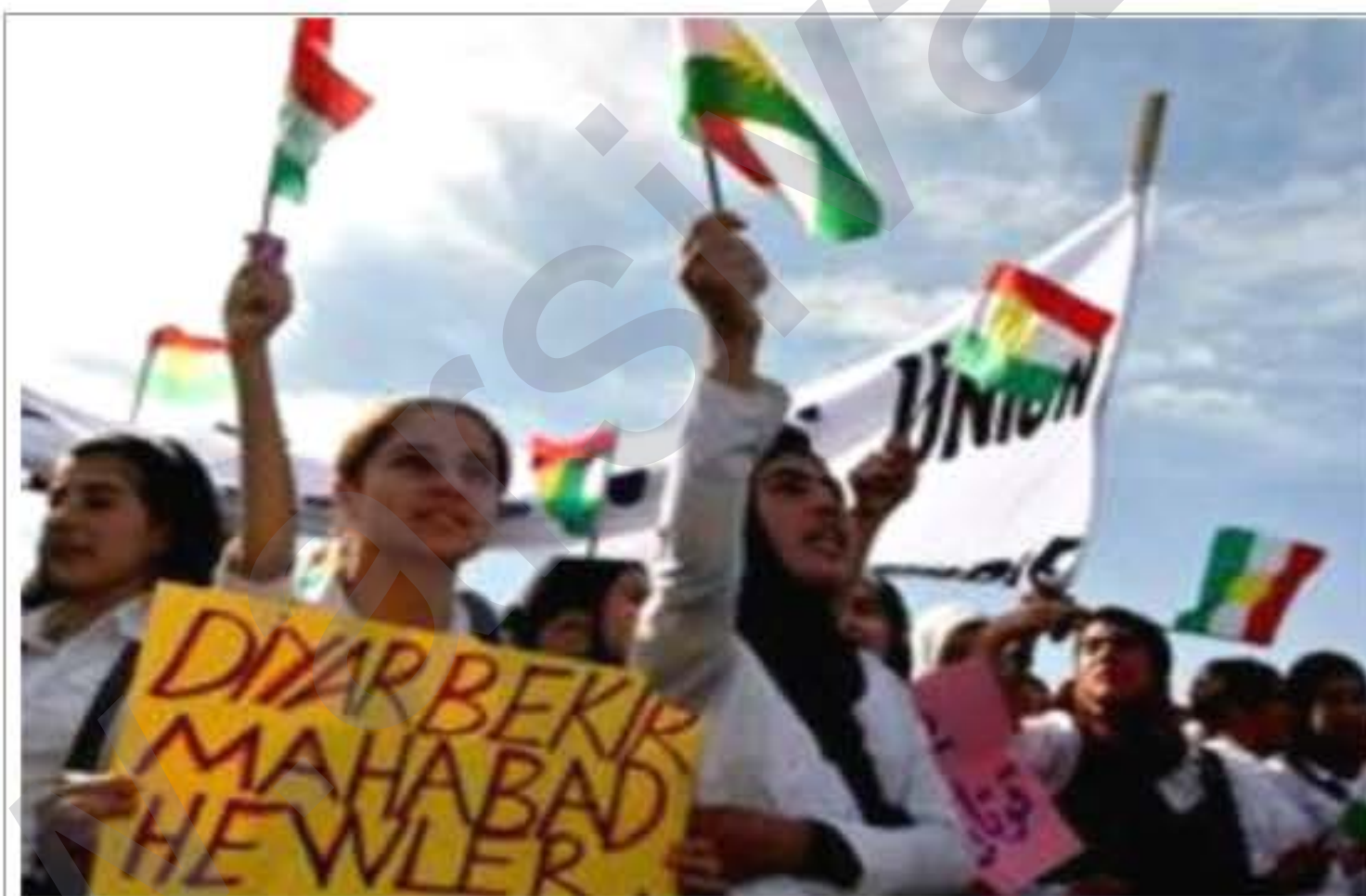
Divê edî her hêz û aliyê Kurd ji bo yekitiyê bikeve tevgerê

Amed (Pêşketin): Pêwistiya konferansekê neteweyî her roj zêdetir dibe. Li bakûrê Kurdistanê plan û listikên ser pêşaroja gelê Kurd di asteke xeter de ye.