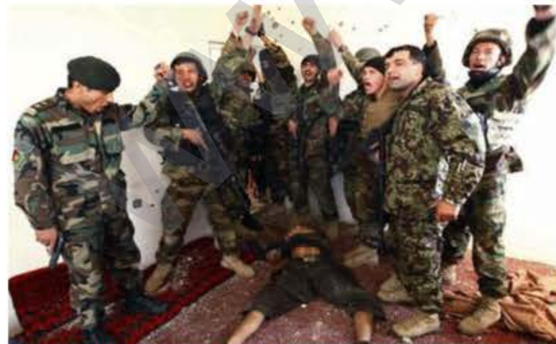
Ev wêne rastiya Efxenistanê radixe berçavan R7