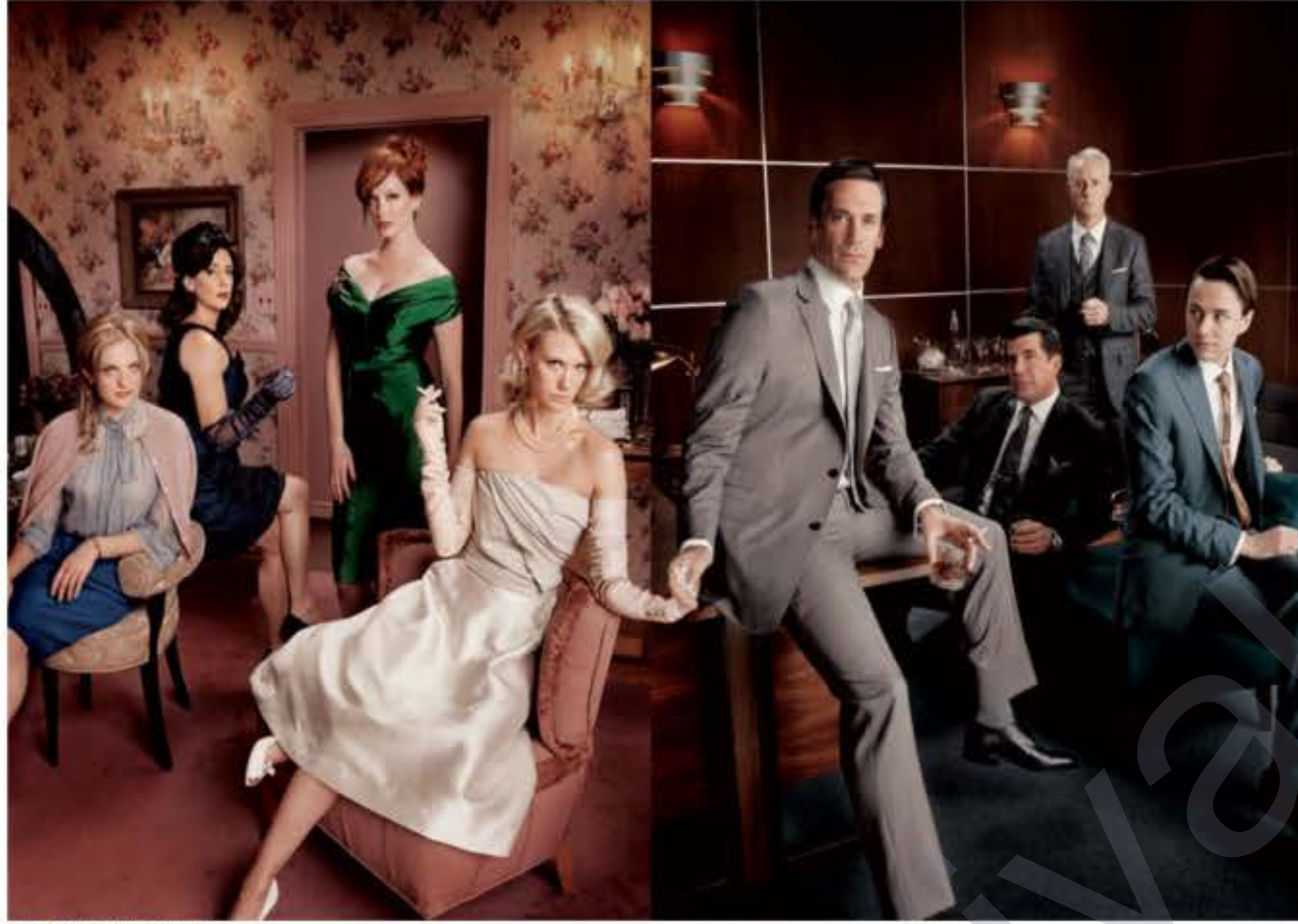
Rêzefilma Med Man