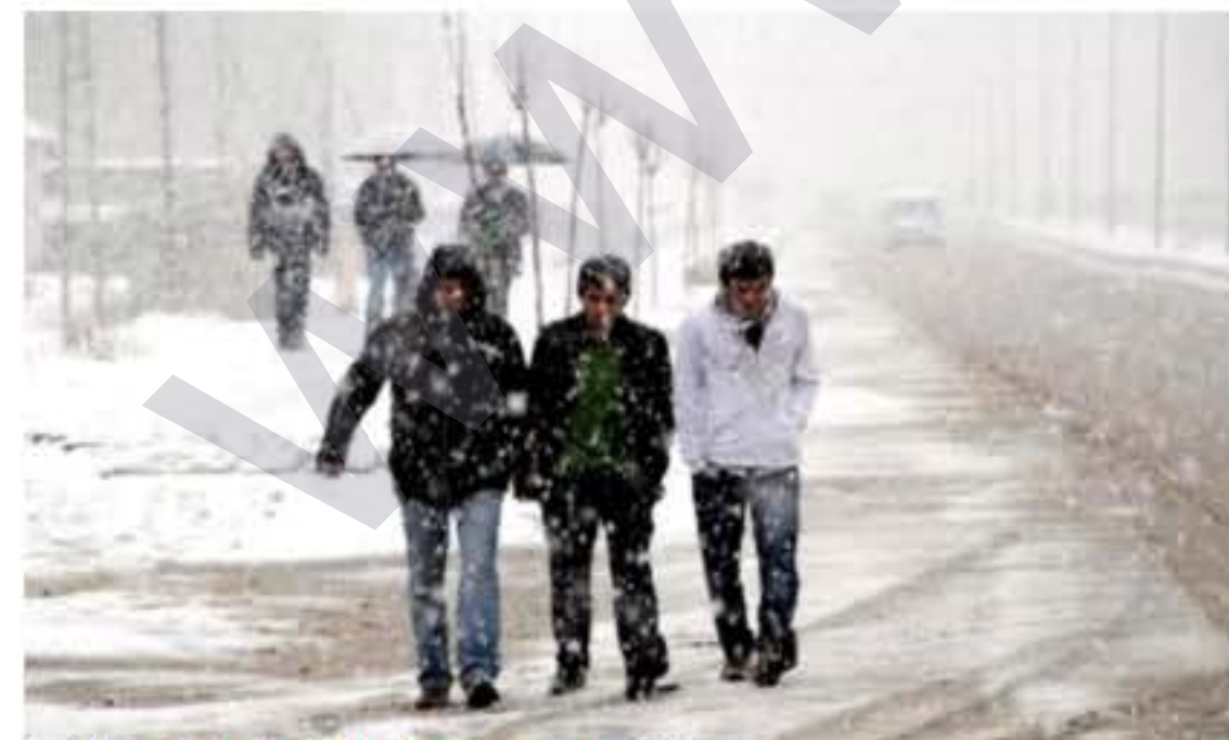
Berfê Kurdistanê girt bin bandora xwe... R4