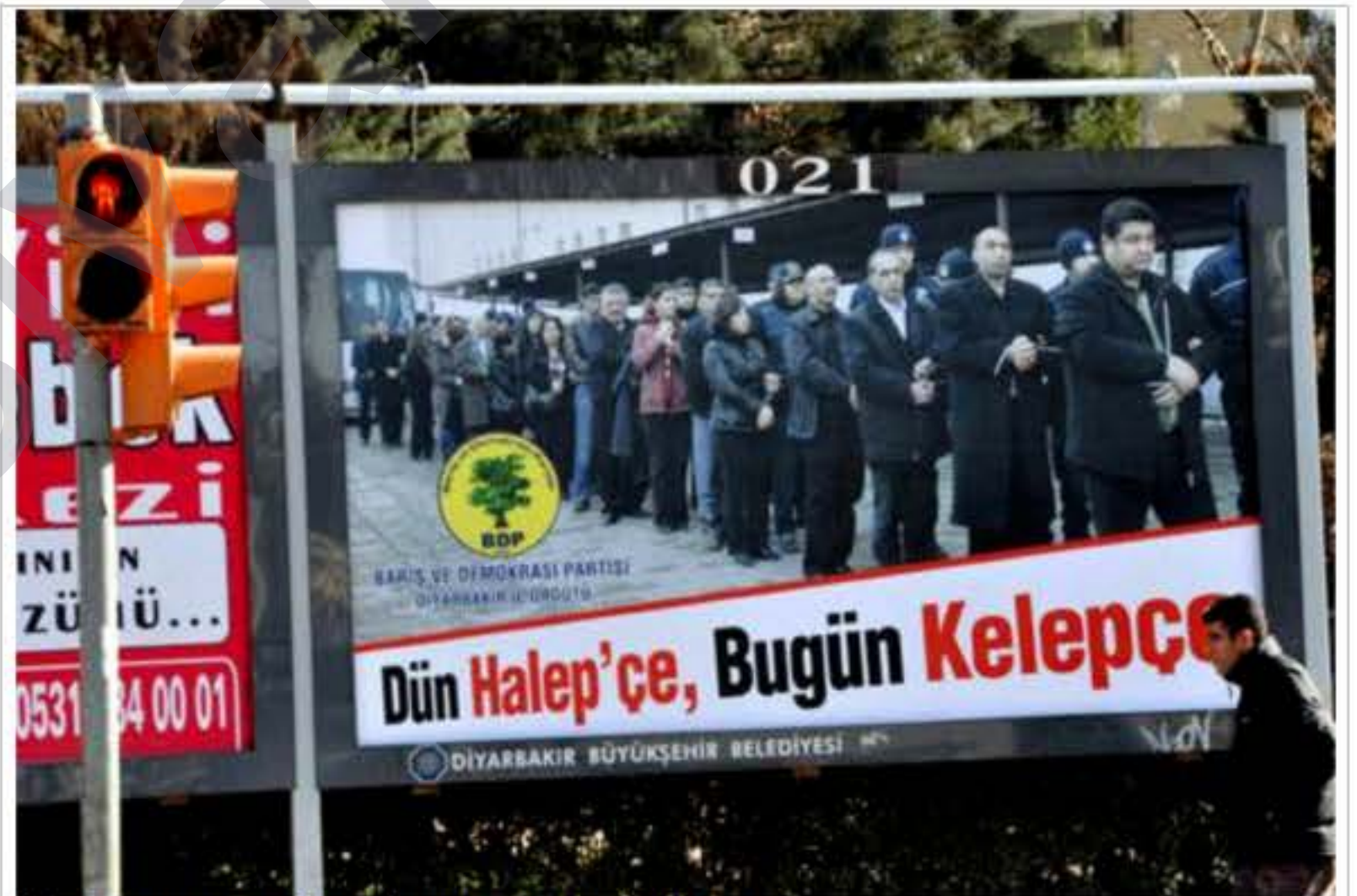
Hêrsa Kurdan hemberî wan dîmenan di asta herî bilind de ye