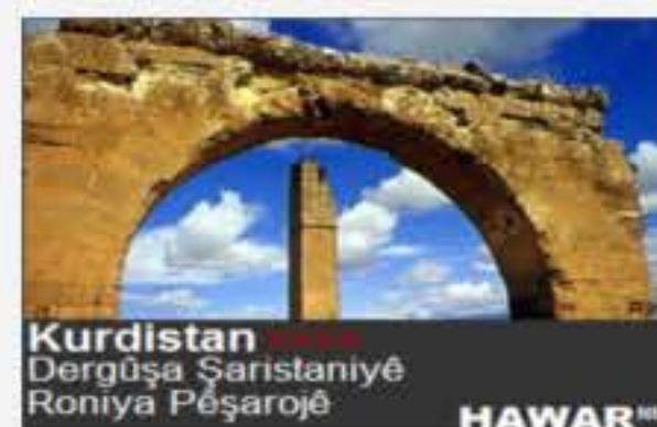
Kurdistan Dergûşa Şaristaniyê Roniya Pêşarojê HAWAR.NET