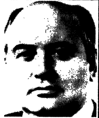
Politik Büroso üyesi seçildi.

M. Gorbachev, 1952'de Komünist Parti üyesi oldu. 1970'te yerel komünist partinin genel sekreterliğine seçilen Gorbachev 1978'de SSCB Tarım Bakanlığında görev aldı, 1980'de SBKP