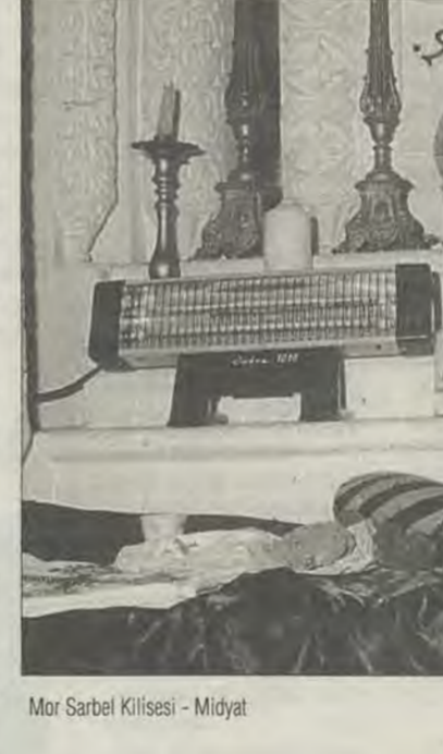
Mor Sarbel Kilisesi - Midyat

yan dilimizi ve törelerimizi benimsemiş olan bu Türk Hıristiyanlara, menseleri de dikkate alınarak Türko-Semit adını verdik. Türko-Semitler Türkler'den ayrı bir millet değil, Türki bir cemaat özelliği göstermektedir."