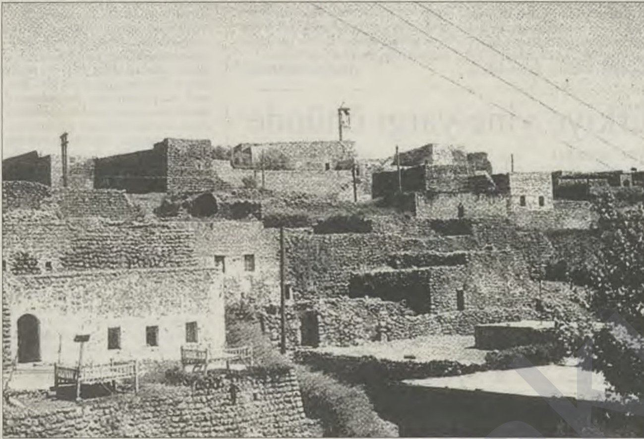
Bir Süryani köyü olan Hasibrin, Tur Abdin

İstanbul'da Süryaniler'in oturduğu yirmiyi aşkın köy tamamen boşaltıldı. Süryaniler'den tamamen boşalan köylerden bazıları şunlar: Midyat'ta Elbeyendi (Kafro Tahtayto), Barıncık (Bote), Bağlarbaşı (Arnas), Yamanlar (Yardo), Barıştepe (Saleh), Mercimekli (Hapsis), Güngören (Keferbê) Nusaybin'de: Dağıcı (Xirabemışkê), Üçyol (Sêderi), Güzelsu (Ehvo), Dibek (Badibe,