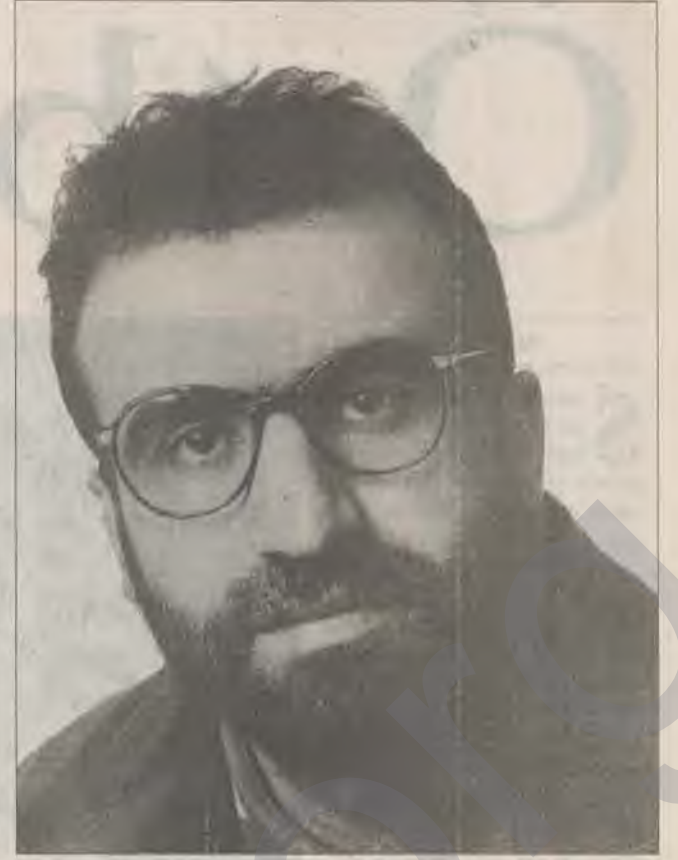
○ Biraz önce değindiğim furya vurgunundan sonra gelinen aşama ve varılan bilinç, bir sanatçı olarak beni umutlandırıyor. Çok iddialı yapıtlar yapıyor. Senfoni düzeyinde müzikler üretiliyor. Kürt Müziği geçmişten kopmadan güncel ulaşma yolunda, belki de güncelden evrensel ulaşma safhasında ileri bir aşamaya geldi. Bu güne ulaşmada Kürt sanatçılarının hiç bir çıkar ve maddi kazanç gözetmeden çalışmaları yapmasının önemi çok büyük. Bu çalışmaların ölkede ya da coğrafyamızın bu parçasında olduğu kadar, Avrupa'da da geliştiğini ve gün geçtikçe mükemmelleştiğini görmek, gerçekten Kürt insanına layık olduğu müziğin ulaşması açısından kıvanç verici.

Bana göre, Kürt Müziği'nin otantizminde rock, jazz, blues vb. tarzlar zaten mevcuttur. Buna bir örnek vermek gerekirse, Kürt Folklorunun govend yapma tarzında bile rock mevcuttur.