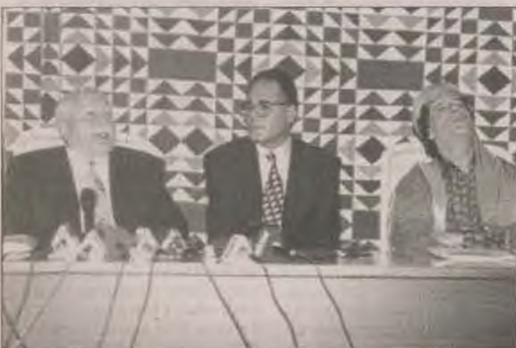
Erbakan'ın Libya ziyaretinde Kaddafi'nin gerçekleri dile getirmesi TC'yi sarstı.

mermi ve patlayıcıyı İran'dan yükleyip Suriye'ye götürmek isteyen üç Türk TIR'ı Hatay'ın Civegözü sınır kapısında ele geçirildi.