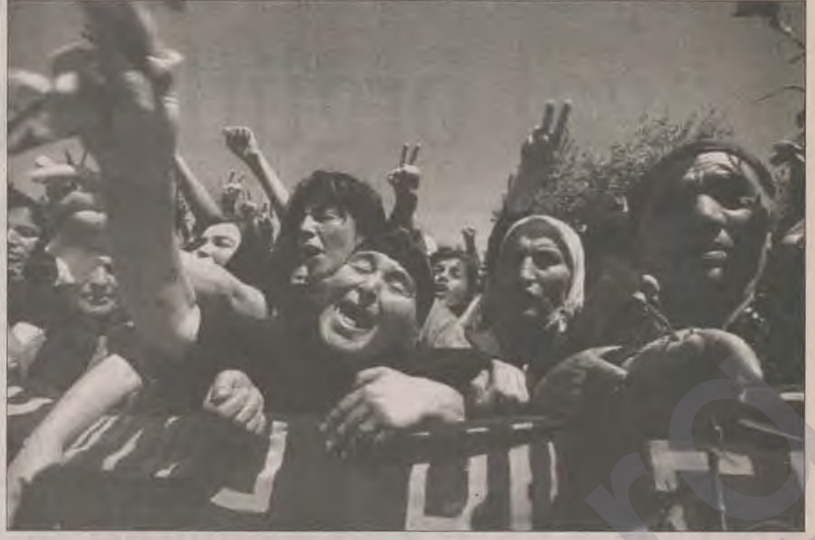
1996 yılı da önceki yıllar gibi kirli savaşta oğullarını yitiren anaların gözyaşları ile ıslandı, onların haykırışıyla sarıladı.

vermemesi üzerine 1996 yazında ateşkesin fiilen sona ermesiyle birlikte PKK eylemleri artışı gösterdi.