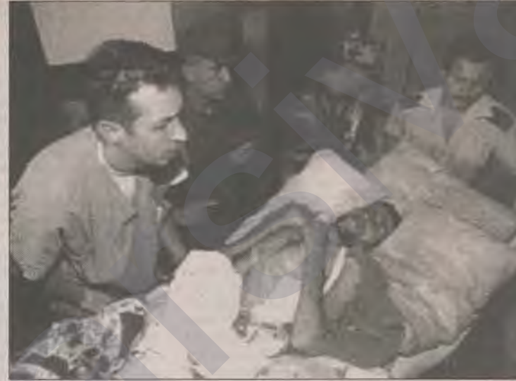
Ölüm orucu ve süresiz açlık grevinde 12 tutsak yaşamını yitirdi.

başkanı Demirel ile üniversite sorunları görüşürken, akademik haklarını meyanlarda arayan öğrencilere polis yine saldırdı. 100 öğrenci yaralandı, 127 öğrenci de gözaltına alındı.