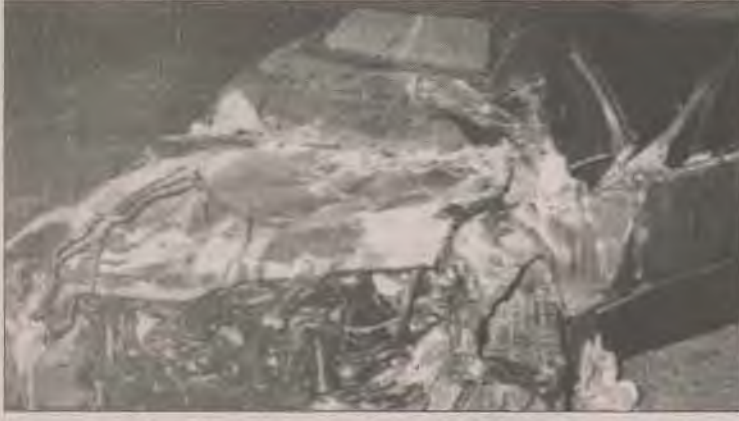
1996 yılının sonlarına doğru meydana gelen Susurluk kazası konuşulmaya devam edilecek.

1996 yılının önemli gelişmelerine damgasını vuran, Kürt halkına karşı devletin yürüttüğü savaş gerçeği ve bunun sonuçları oldu. 96 yılında yaşanan hükümet krizlerinden Susurluk kazasına kadar can alıcı olayların düğümlendiği nokta, Kürt sorunu ve bu soruna karşı silah doğrultan devletin savaş politikalarıydı. Bu nedenle 96'nın iz bırakan gelişmelerini sunduğumuz tabloda coğrafya ayrımı yapmadık; çünkü nerede olursa olsun, önemli olayların ucu zaten Kürt coğrafyasına dönüktü.