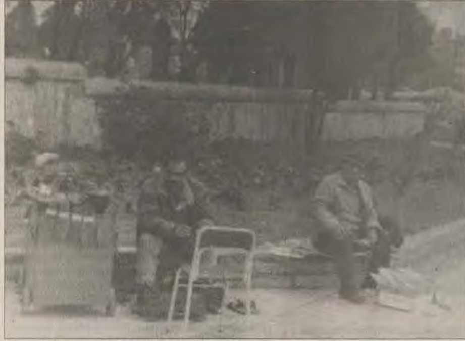
Yüksek derecede acı çeken ülkeler kategorisindeki Türkiye, "yurttaşlık hakları"ndan yalnızca 2 puan aldı.

Ülkelerin 'acı çekme' haritasını çıkararak Nüfus Krizi Komitesi, "yüksek oranda acı çekilen ülke" notu verdiği Türkiye'yi Kongo, Yeni Gine, Bangladeş'le aynı kategoride değerlendirdi