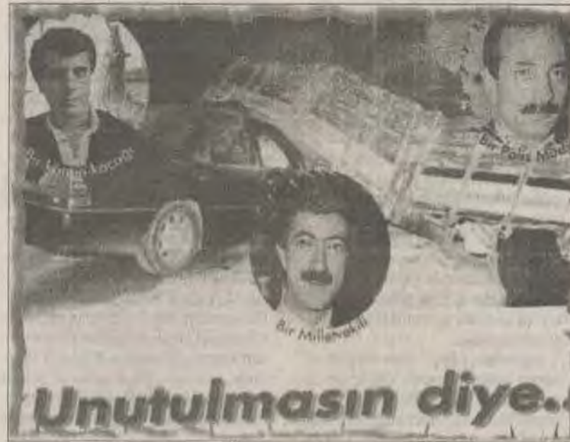
ÖDP'den 1997 çete kartı.

Rum-Ermeni ve Musevilere karşı 6-7-1955 Eylül olayları planlayıp-