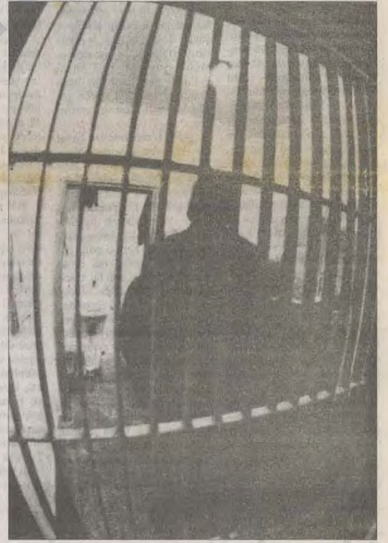
Türkiye'nin "acı çekme" oranını yükseltti konularını başında yasak ve cezalar yer aldı.