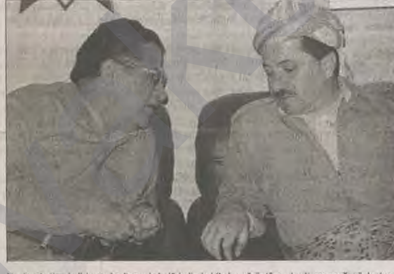
Ateşkes hattını belirleyen haritanın kabulü halinde bile bu görüşüyle ulaşılamayacağı söyleniyor

Bu arada KDP yetkilileri, Talabani'nin 23 Ekim'de varılan ateşkes anlaşmasına uymadığını belirterek, harita düzenlemesine ilişkin kuşkuyla da dile getiriyorlar. Öte yandan, Barış İzleme ve