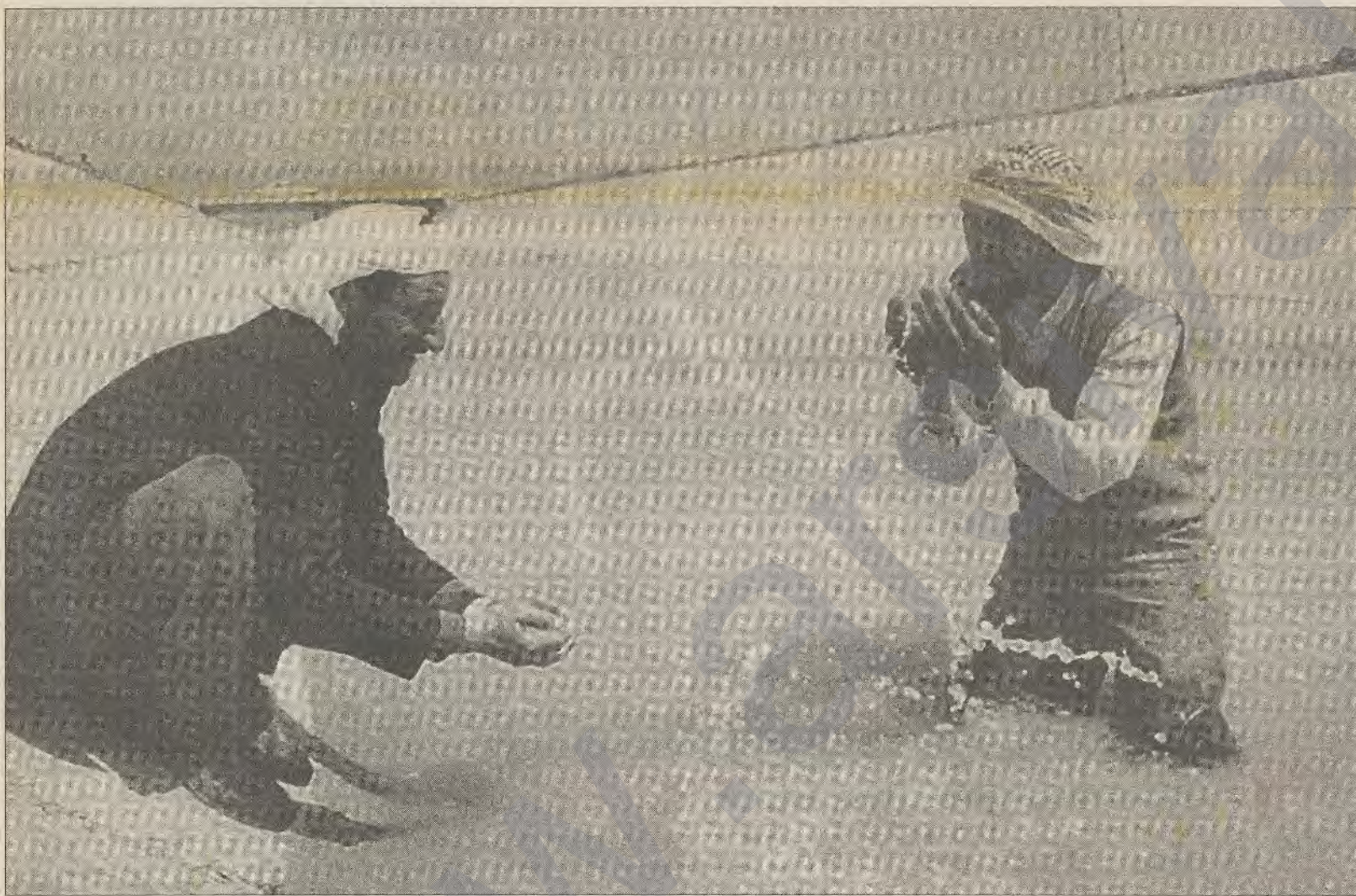
SU, SEVİNÇ GETİRMEYECEK- Diyarbakır Tabipler Odası'nın raporunda sulu tarıma geçişle birlikte GAP alanındaki yerleşim birimlerinde iklimin, tropikal hastalıklara davetiye çıkaracak şekilde değişeceği açıklandı.