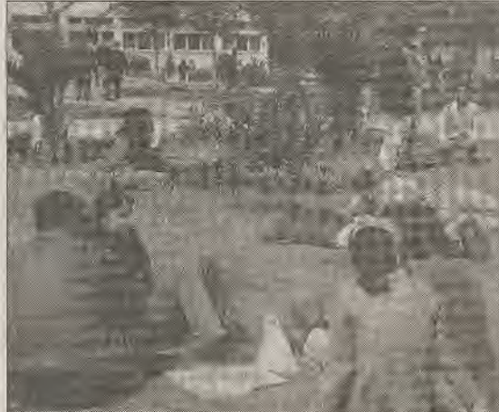
Araştırmaya göre bayan öğrencilerin %83.6'sı, erkeklerin %62.3'ü cinsel ilişkide duygusal yakınlığın gereğini vurgulamış...

Daha güzel bir yaşam, insana yakışır bir dünya için kadınların ve erkeklerin birlikte mücadelesi bir zorunluluktur. İşte bu mücadele sürdürülürken erlenen aşk ve cinsellik kavramları da hayatımızdaki yerine en olumlu şekilde bugünden yerleşmelidir. Giderek yabancılaştığımız bu iki kavramla yakala-y a c a ğ ı m ız mutluluk için hem kadınlar, hem de erkekler mutsuzluğu yaratan sosyal ve ekonomik engelleri aşacak ortak mücadeleler geliştirmesi gerekiyor.