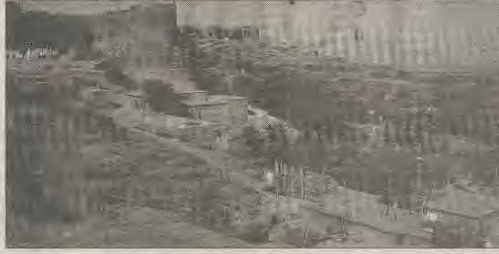
Diyarbakır tüccar ve sanayicileri kentin ve bölgenin sorununu 'kalkınma'ya bağlıdır.

Devlet Planlama Teşkilatı tarafından Türkiye'nin 1993 yılındaki idari yapısı baz alınarak yapılmış olan bir araştırmaya da atıfta bulunulan raporda, sözkonusu araştırmaya göre bölgesel dengesizlikle ilgili çarpıcı bir sonuç ortaya çıktığı belirtiliyor ve şu görüşlere yer veriliyor: "858 ilçeye ait gelişmemişliğin 32 değişik inçelenmesi ile en az gelişmiş ilçelerin hemen hemen tamamının Doğu ve Güneydoğu Anadolu Bölgesi'nde olduğu tespit ediliyor. Yine en gelişmiş ilçeler arasında ise tek bir