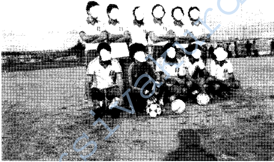
KURDİSTAN-SPOR FUTBOL TAKIMI BİR MAÇ ÖNCESİ

linçlenmenin neticesiydi Kürdistan-Spor. Bu nedenle Kürdistan-Spor'un başarıya ulaşmaması ve bir an evvel dağılması için, legal ve illegal provakasyonlara giriştiler. Ama güçleri yetmedi. Kürdistan'ın dört parçasında, bilinçlenme ve örgütlenme sürdükçe, Kürdistan-Spor ona paralel olarak başarıdan başarıya koşacak, büyüyecek ve gelişecektir. Bunun neticesidir ki, kendi grubunun şampiyonu oldu Kürdistan-Spor 1983'te.