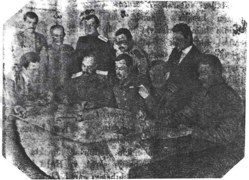
Büyük harpte Erzincan mütareke komisyonu

Dersim delegeleri Sovyet ordusu içindeki parti yetkilileri ve Türk ve Ermeni delegeleriyle belediye binasındaki kısa bir tanışma toplantısından sonra kerim oğlu mahalesinde Ermeni komitesince misafir edildiler. Ertesi gün Erzincan ve çevresinden gelenlerle belediye meydanında büyük bir kitle toplantısı düzenlendi. O zamana kadar Erzincan'ın gördüğü belki ilk büyük kitle toplantısıydı. Erzincan halkı ilk defa kendi istek ve iradesinin belirleyici olduğunu, gelişmelerden haberdar edildiği iradesinin dikate alındığını görüyordu. Kendi gücüne olan inancı artıyor ve kendi temsilcilerini yöneticilerini kendisi seçiyordu.