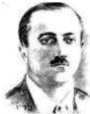
Osman Sebrî 1905 - 1993

Xebat ji bo : * Zordarî ji ser gelê me yê Kurd li Sûriyê rabe . * Azadiya demokrat û rêzgirtina mafên mirovan . * Mafên gelê Kurd yên netewî di çarçewa yekîtiya welêt de .