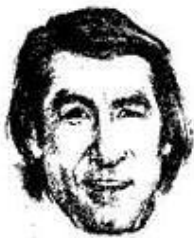
Dr Nûredîn Zaza 1919- 1988