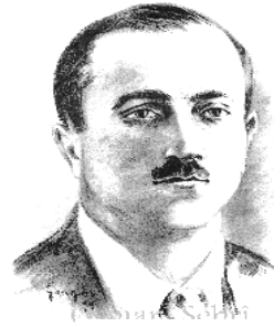
Osman Sebrî 1905 - 1993

Xebat ji bo : * Zordarî ji ser gelê me yê Kurd li Sûriyê rabe. * Azadiya demokrat û rêzgirtina mafên mirovan. * Mafên gelê Kurd yên netewî di çarçewa yekîtiya welêt de .