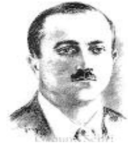
Osman Sebrî 1905 - 1993