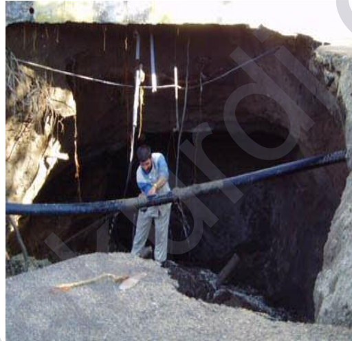
Wênayên xişim û bêtara Serê Kaniyê

Li hember wê xişm û bêtarê, destlata Sûriyê matmayî dimîne , bêyî ku alîkariya wan bike .Bi navê komîta weşana NEWROZ û xwendevanên wê, em serê wan saxdikin û cihê wan bihuşt be.