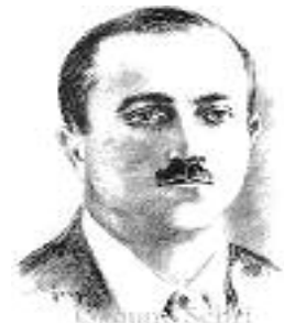
Osman Sebrî 1905 - 1993

Xebat ji bo : * Zordarî ji ser gelê me yê Kurd li Sûriyê rabe. * Azadiya demokrat û rêzgirtina mafên mirovan. * Mafên gelê Kurd yê netewî di çarçewa yekîtiya wellêt de .