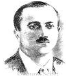
Osman Sebrî 1905 - 1993

Xebat ji bo : * Zordarî ji ser gelê me yê Kurd li Sûriyê rabe.