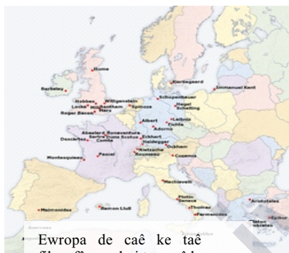
Ewropa de caê ke taê filozofê namdari tewr zêde lebetiyaê

Merhemê felsefeyê bîni ki, xo dergê tertîb u nîzamê zanayîşê insaniê sistematîki kenê ke tede qîymet u hîquq u wezîfeyanê merdumaneyan ra pia yew fikr u îdey dînya salê bîvîraziyo.