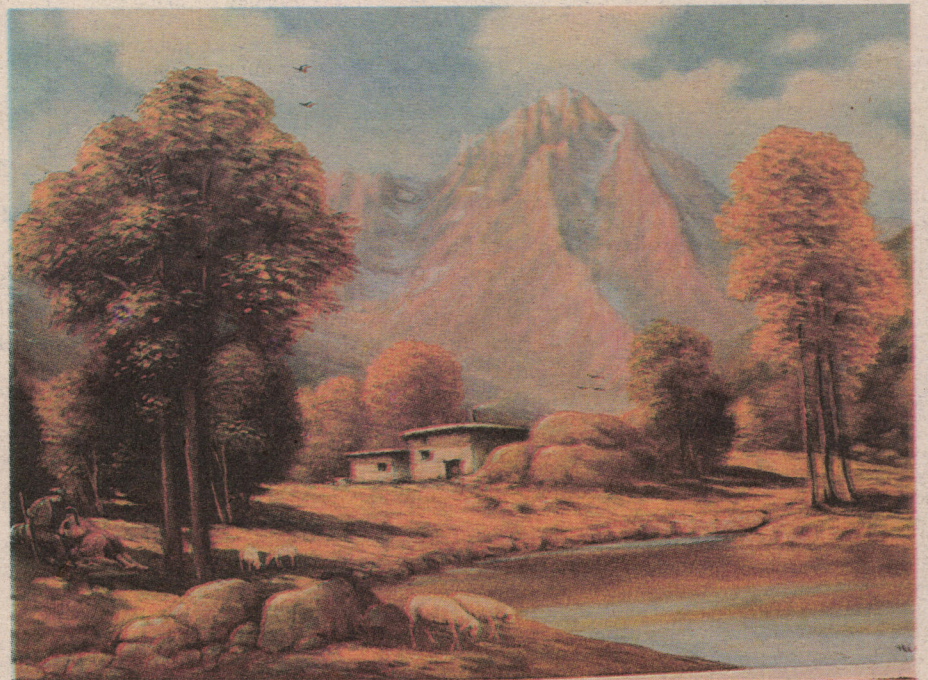
Tabloyeke Sebah Cizîrî