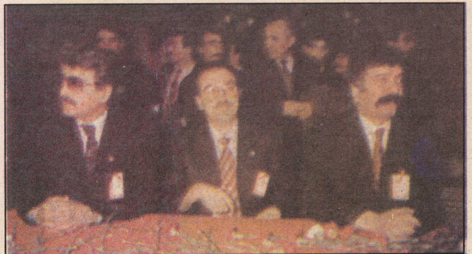
Genel başkan adayları Kongre salonunda birarada