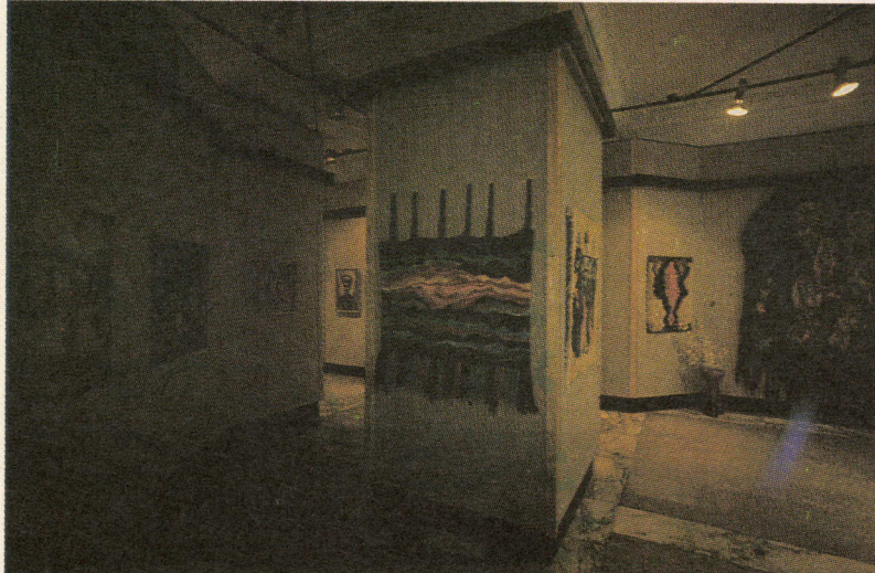
Sergiden bir görünüm

Sergiyi gezmeyi sürdürüyorum. Değişik sıklıkta tüylü yumuşak tablolar, yün iplikler küçük hareketlerle sanki canlanıyor. Ufacık renkler tabloları hep hareketli kılıyor. Değiştiriyor. Mesela tek bir tabloda kırmızı rengin 15 çeşidini saydım. Besê'nin örgü stili tamamen köy ev ve insan-