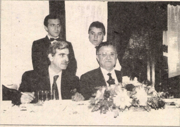
Talabani HEP'in Yemeğinde