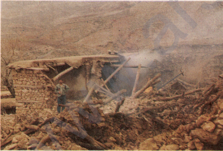
"Ma Kurd biyayen sûc o?"

DIYARBAKIR (Medya Güneşi) - Diyarbakır'ın Dicle ilçesine bağlı köylerde korucu ve TC güçleri tarafından olanca hızıyla bir terör estirilmiştir. Operasyon adı altında köylere gidilerek köylüler dışarı çıkarılıyor, halka işkence yapılıyor, evler ateşe veriliyor, kısacası alışlagelmiş barbarlıklar birbir sergileniyor.