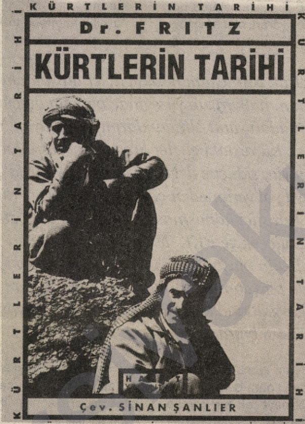
"Dr. Fritz'in 'Kürtler, Tarihi ve İçtimai Tetkikat' adlı eserinin Hasat Yayınları tarafından Sinan Şanlıer'in Osmanlıca'dan çevirisiyle 1992'de İstanbul'da 'Kürtlerin Tarihi' adıyla yayınlanan baskısı.

Hem Kürtler hem de Türkmen Aşiretleri adlı kitap, Aşair ve Muhacirin Müdiriyet-i Umumiyesi yani Aşiretler ve Göçmenler Genel Müdürlüğü tarafından yayınlanmıştır. Bu kurumun bir devlet kurumu olduğu ve Türkmen Aşiretleri adlı kitabın Harp Mecmuası'nda ilânının çıktığı da düşünülürse yazarın İttihat ve Terakki çevrelerine yakın birisi olduğu anlaşılır.