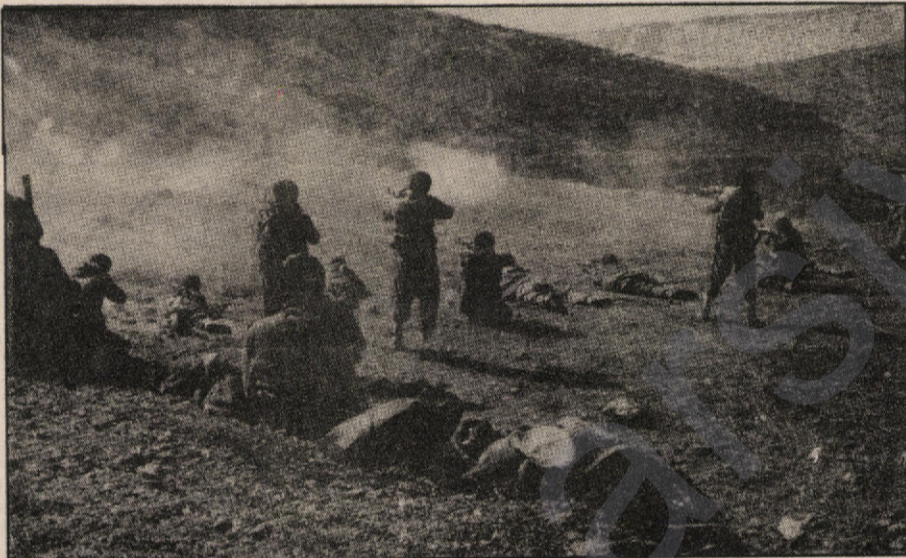
Gerîlayên PKK'ê di darsa perwerdekirinê de

Li ser vî bûyerê jî gelek dewletan alîkarî şandin Misirê.